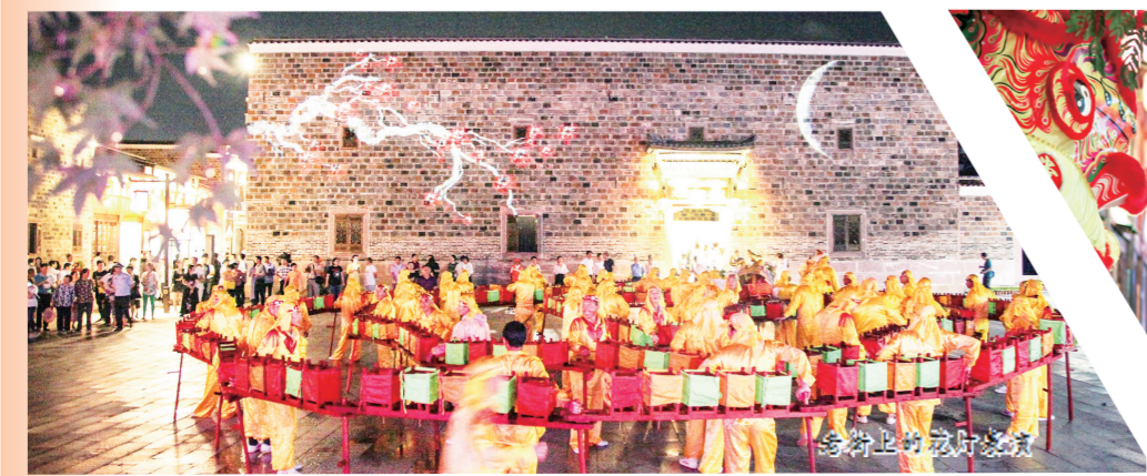
举行上的龙舟竞赛