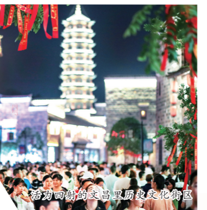
活力四射的文昌里历史文化街区