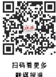
扫码看更多 融媒报道

2023年,将加快推进昌北国际机场三期扩建工程、昌北国际机场区域性智慧空港物流中心建设,统筹推进昌北国际机场三期扩建配套路网工程、机场高速公路工程建设。(下转第2版)