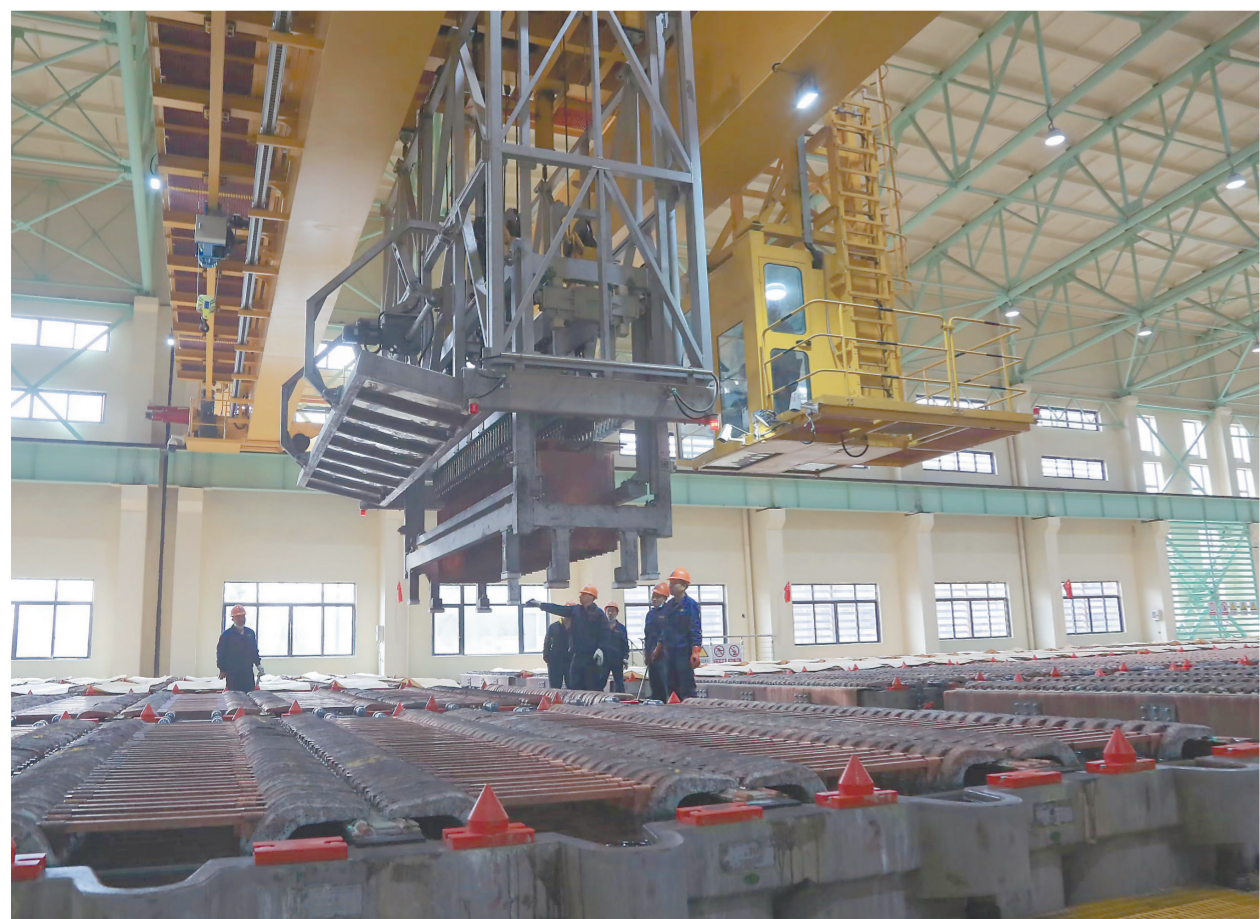
1月23日,在位于横峰经开区的和丰铜业智能电解车间,工人们正在加紧生产。春节期间,横峰县重大项目不停工、重点企业不停产,一线工人坚守岗位,加班加点促生产、忙建设,掀起“不停工、不停产”的干事创业热潮,助推全县经济发展。