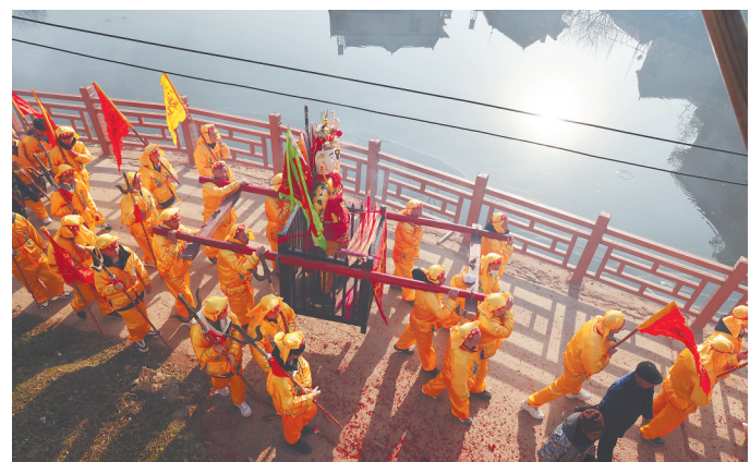
上岸后的乐平市镇桥镇渔业村渔民参与传统民俗表演。