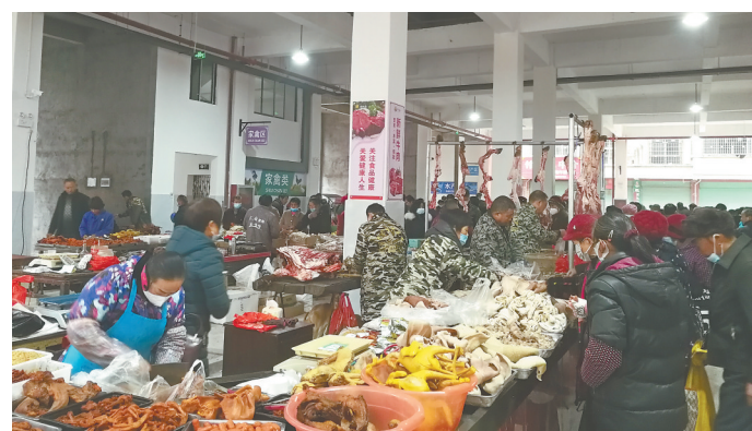
提升改造后的樟树市刘公庙镇农贸市场,焕然一新,井然有序。