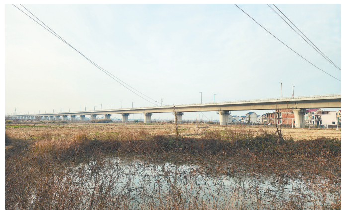
预计今年开通的昌景黄高铁穿镇而过,将给紧挨着鄱阳南站的鄱阳县饶丰镇带来新机遇。

乡情,是每一个中国人都无法摆脱的情怀,对于党报记者而言同样如此。在过去的一年时间里,记者们用文字和镜头记录着他乡的变化,心里也牵挂着家乡的变化。春节假期,回乡的记者真切地感受那最熟悉的乡土发生的深刻变化:通了新的高速公路,渔民上岸安居乐业,村里有了工业园,高标准农田改造如火如荼开展……新闻没有假期,记者总在路上。春节期间,本报记者把镜头对准自己的故土,用朴实的语言,描绘令人振奋的时代图景和人民群众实实在在的获得感。