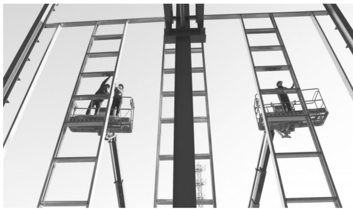
1月29日,在横峰经开区标准厂房建设现场,工人正在进行钢架厂房装配、焊接作业。新年以来,横峰县各重点项目有序推进,奋战开门红。