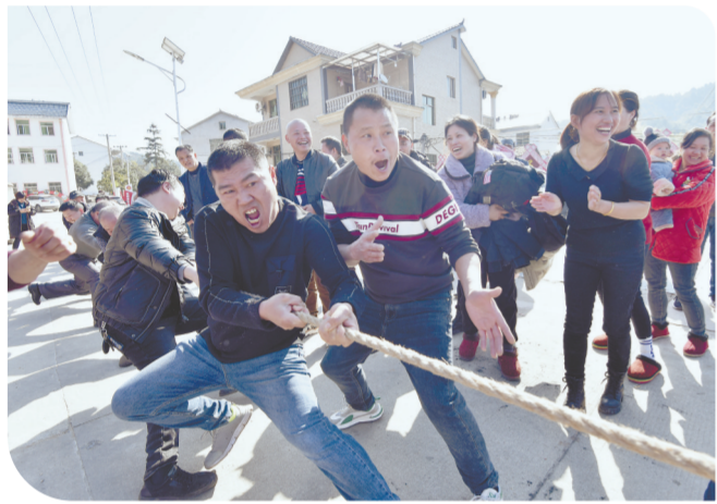
▲1月29日,资溪县高田乡龙英村村民在举行拔河比赛。