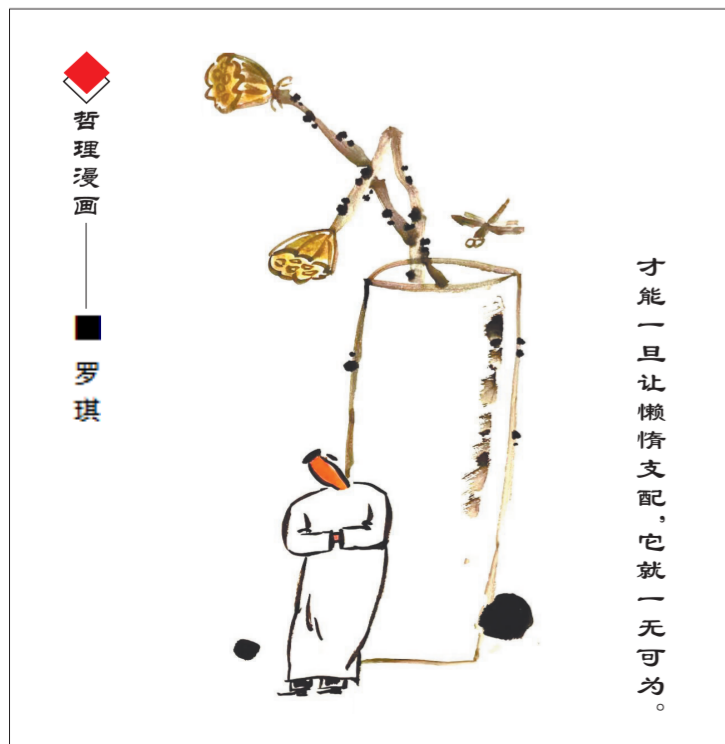
才能一旦让懒惰支配，它就一无可为。