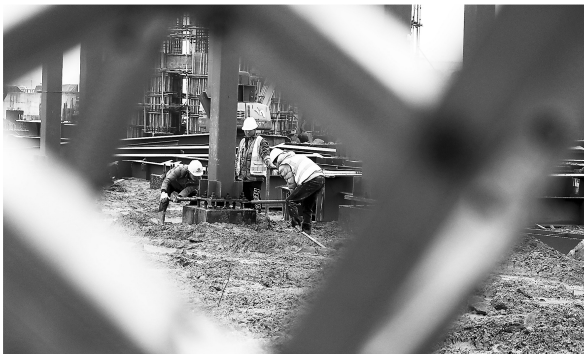
2月6日,施工人员在宜春县花桥乡招商入园的一家企业项目建设工地忙碌。春节过后,该县各企业、项目建设工地快马加鞭抓生产、赶进度,一派繁忙景象。

春种一粒粟,秋收万颗子。为切实保障我省早稻生产供种安全,今年伊始,省农业农村厅种业管理部门积极发挥工作职能,提早谋划、统筹协调,扎实做好春耕早稻备种工作。调度统计数据显示,2023年我省早稻种子总量整体供应充裕,种子企业早稻种子品种比上年增长超过25%。