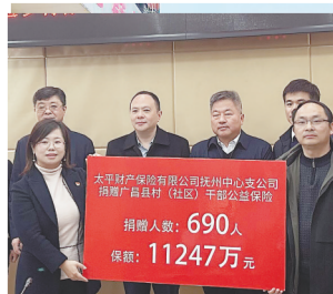
捐赠保险现场。

本报讯(侯艺松)2月7日下午,太平财险抚州中心支公司联合抚州市金融办,为690名广昌县村干部以及困难群众赠送专属保险,累计保额1.1亿元。据了解,该保险结合乡村振兴风险保障需求,可在自然灾害、意外情况等涉及家庭财产、人身安全方面为群众提供风险保障,一年以内有效减轻受保群体因自然灾害、意外伤害带来的经济负担和家庭压力,切实发挥了乡村振兴战略实施的部分兜底作用。