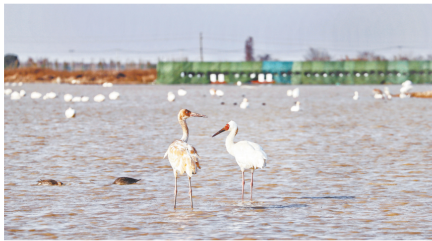
白鹤小镇吸引了众多白鹤聚集。

今年春节假期,不少南昌市民把“新年第一游”选在了南昌高新区白鹤小镇。在文化和旅游部近日推出的“乡村四时好风光——瑞雪红梅、欢喜过年”全国乡村旅游精品线路中,“鹤舞鄱湖观鸟之旅”是其中别具魅力的一条线路,白鹤小镇便是这条线路上的重要节点。在这里,人们可以欣赏候鸟齐飞、渔舟唱晚的优美风景,尽览人与自然和谐共生的美好画卷。借助这一特有资源,当地群众也吃上了“生态饭”,让生活越过越红火。