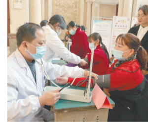
义诊现场。

活动现场,医务志愿者为居民量血压,进行中医诊脉、推拿等,并解答大家的各种健康疑问。同时,向社区