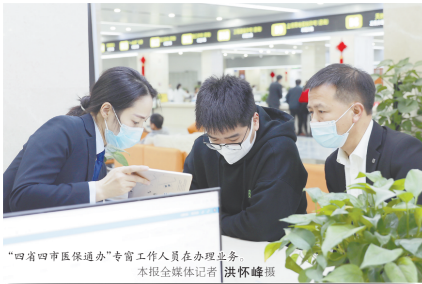
“四省四市医保通办”专窗工作人员在办理业务。