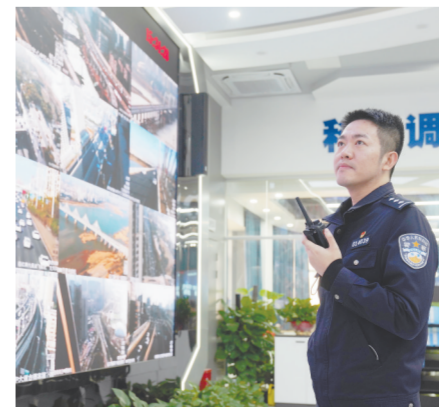
民警通过视频巡查乱变道车辆。

社区,重点加强路面交警中队与街办、社区联动,全面推进文明抄告约谈机制落地见效。”交管局相关负责人表示,局里还开通“南昌交警”微博、“南昌文明交通直播间”“抖音号”等多个渠道,鼓励全社会参与,进一步推进文明交通治理工作。