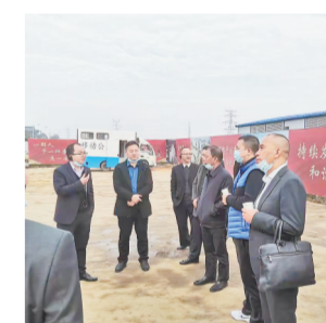
干部深入企业了解情况。