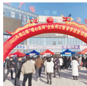
春季就业招聘会现场。

本报讯(全媒体记者洪怀峰)2月6日,上高县卫玲电子科技有限公司总经理戴卫玲向江西新闻客户端“党报帮你办”频道反映,在上高县锦江镇政府部门的帮扶下,公司紧缺的技术人员招到了。据悉,为有效应对今年的返乡潮,助力企业发展,锦江镇当好就业“红娘”服务供需双方。一方面,详细了解全镇劳动力市场情况,另一方面,对辖区企业用工信息进行整理归类,为其送政策、送服务。同时,举办春季就业招聘会,开展“送岗下