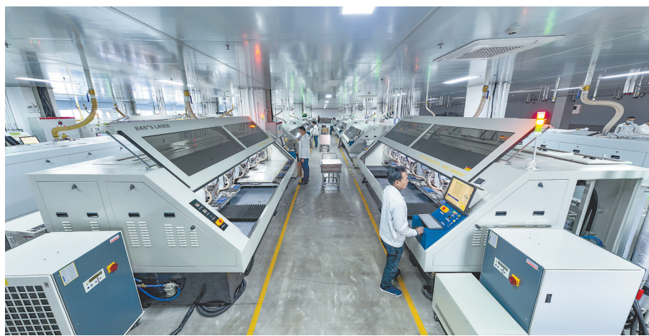
在江西山旭精密电路有限公司生产车间内，工人们忙着赶订单、抢进度。

为进一步提升农业机械化水平，我省还提前下达2023年度中央财政农机购置补贴资金51894万元和省级财政资金8000万元，并大力推进水稻机械化育秧中心、省级全程机械化综合农事服务中心建设。据农业农村部门调度，全省各地准备春耕备耕农机具71.62万台套；建成水稻机械化育秧中心399家、省级全程机械化综合农事服务中心89个。