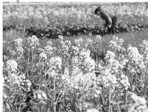
2月12日,村民在贵州省安顺市西秀区宁谷镇大鼎寨村田间劳作。