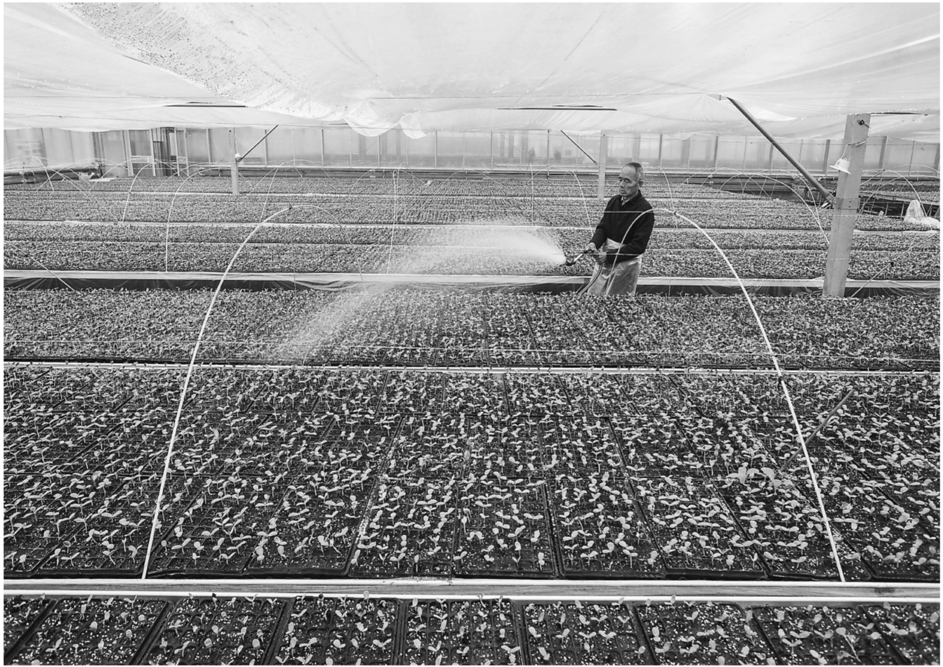
2月12日,在湖南省怀化市通道侗族自治县万佛山镇坪地村,农民在收割蔬菜。

鼓励、引导企业加大研发投入,大力培育专业化“小巨人”和“专精特新”企业,加快传统产业转型升级,推广智能制造普及应用,有力提升了制造业数字化、网络化、智能化发展水平。2022年,该市122家企业获评江西省两化融合示范企业,数量列全省第二,其中5G+工业互联网应用示范方向16个,数量列市区第一。