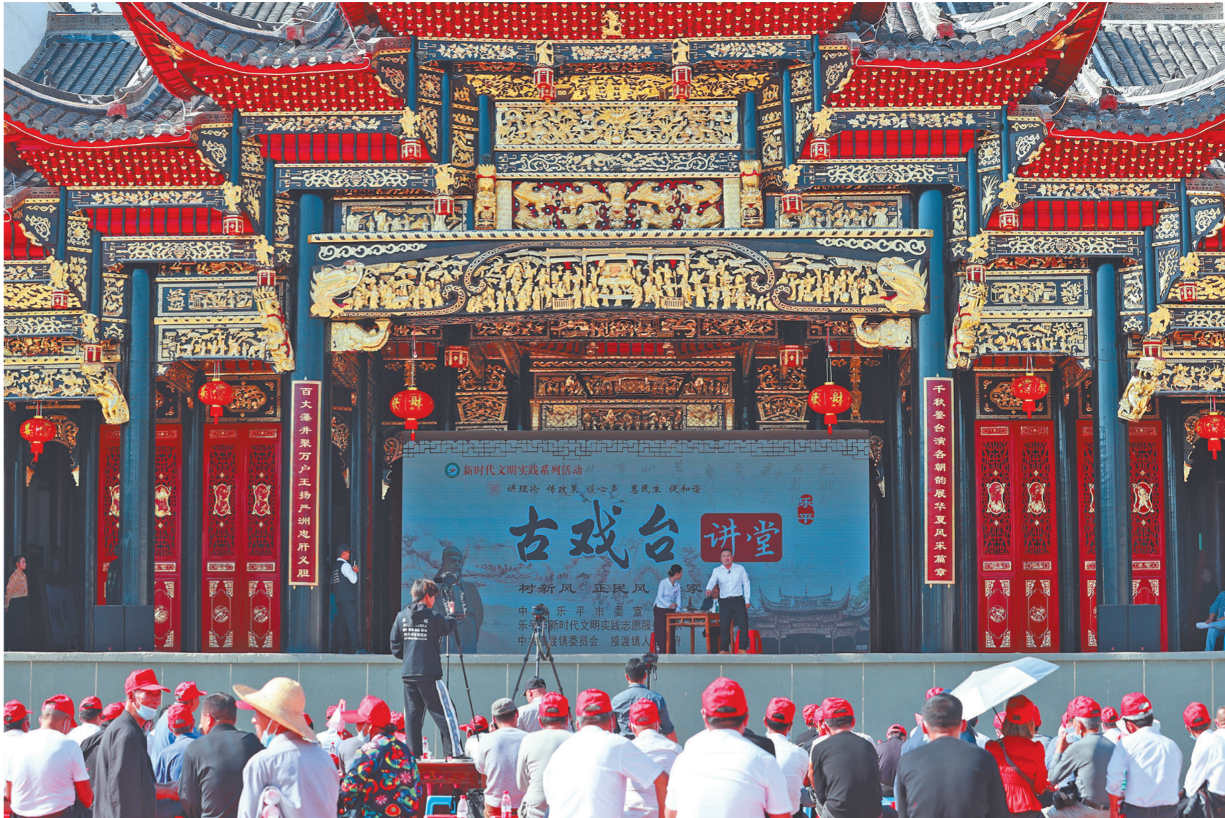
在乐平市接渡镇严洲村，全国基层理论宣讲先进集体——乐平“古戏台讲堂”的宣讲，让现场300余名群众在欢声笑语中理解理论深意。