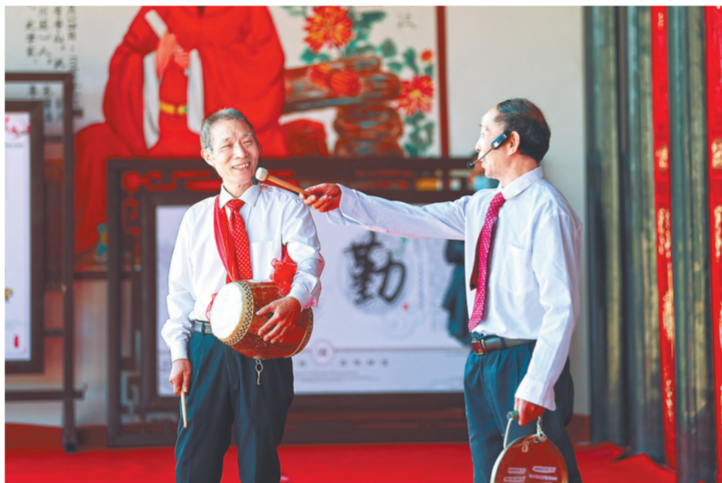
在乐平市接渡镇严洲村古戏台上，志愿者通过曲艺形式，推动党的二十大精神“飞入寻常百姓家”。