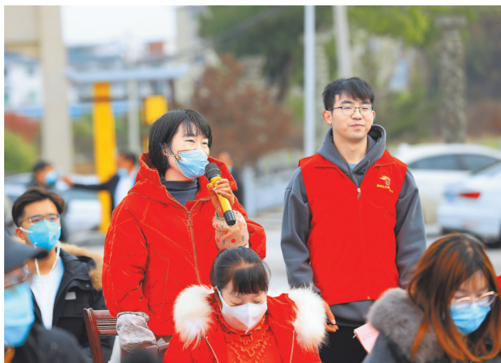
在萍乡市湘东区东桥镇长潭村文化广场，村民在宣讲现场踊跃互动。