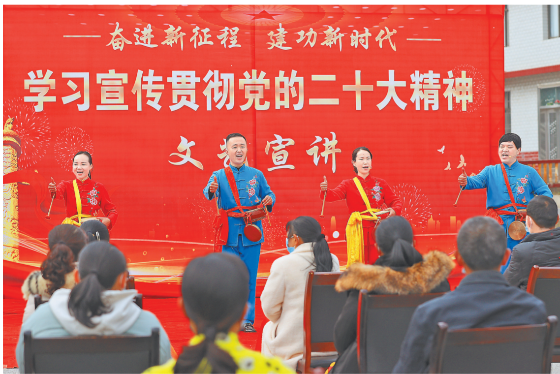
萍乡市湘东区东桥镇长潭村文化广场锣鼓嘹亮，全国基层理论宣讲先进集体——“学习伙伴”理论宣讲队志愿者用萍乡春锣这种民间曲艺形式，兴致高昂地宣讲党的二十大精神。