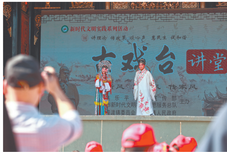
宣讲活动与戏曲演出相结合，让理论宣讲更接地气。