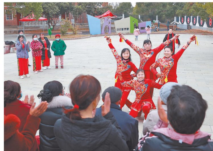
在鹰潭市余江区春涛镇坞桥村，“板车宣讲团”志愿者精彩的快板表演，赢得了在场观众阵阵掌声。