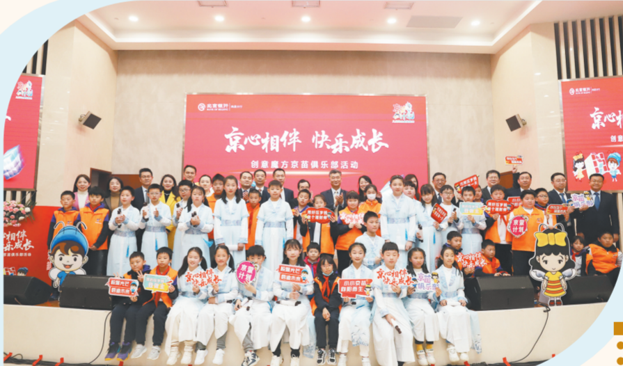
北京银行南昌分行举办“京心相伴 快乐成长”创意魔方童乐俱乐部活动

重大重点项目是经济发展的强引擎，也是稳增长、惠民生的重要支撑。12年来，北京银行南昌分行围绕江西省基础设施建设项目、重大产业项目、民生项目，不断加大金融支持力度，先后支持了南昌市梅湖景区花博园提升改造配套路网项目建设、江西省南昌航空城防洪排涝一期工程、江西慧谷用友南昌产业园二期项目建设、南昌泉岭生活垃圾焚烧发电厂项目等一批重大项目。其中，南昌泉岭生活垃圾焚烧发电厂扩建工程项目获评“江西省绿色金融优秀项目”。