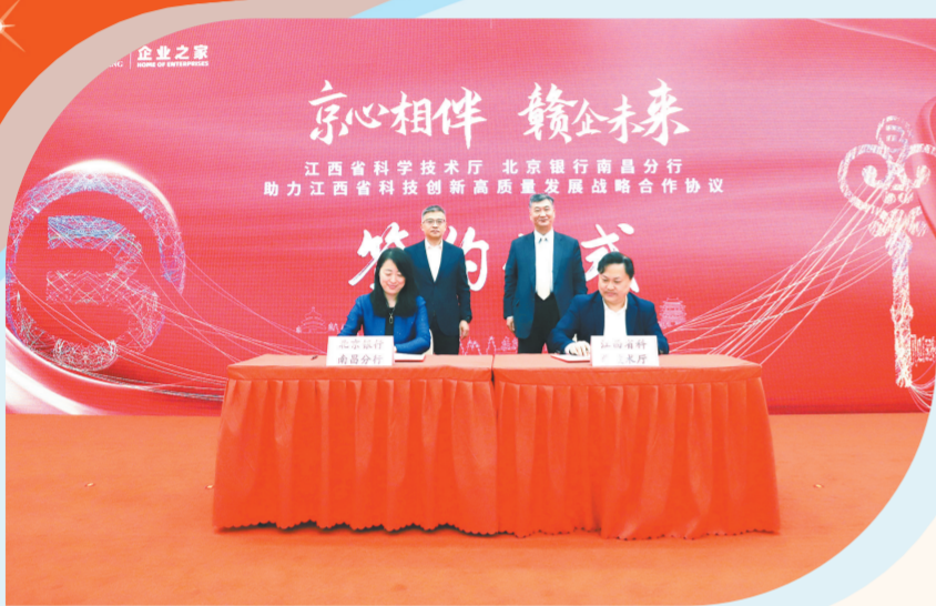
北京银行南昌分行与江西省科技厅签署战略合作协议

2011年3月29日，作为京赣深化合作的重要标志，北京银行南昌分行正式落户赣江之滨，开启了情系赣鄱、服务老区发展的奋斗征程。 12年来，北京银行南昌分行深耕赣鄱、奉献赣鄱，在支持江西经济社会发展中创佳绩、讲担当、谋共赢。截至今年2月末，北京银行南昌分行网点覆盖南昌、赣州、九江这条江西经济南北“主动脉”，表内外资产总额超1030亿元，各项存款余额近480亿元，各项贷款余额超710亿元，累计向江西投放资金2500多亿元，服务中小微企业超3300家，以实际行动架起北京与江西经济共融发展的桥梁，为续写京赣高质量合作新篇章贡献金融力量。