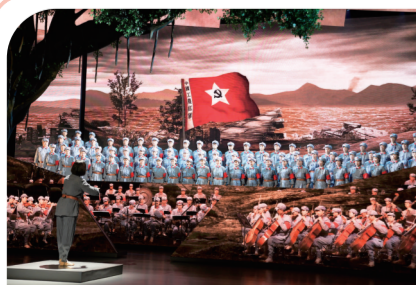
排练红色经典《长征组歌》