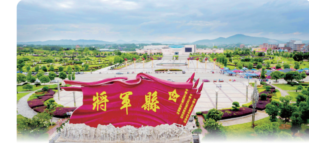
兴国县将军园广场

兴国规划精品文旅线路，将文旅资源串珠成链，推动文化和旅游深度融合。提升红色场馆和纪念地服务水平，以长征国家文化公园（兴国段）、永丰“扶贫井”等一批重点文旅项目为“点”，以兴国中央红军长征出发准备重点展示园、崇贤茶旅小镇等一批特色、人文园区小镇为“线”，以点连线、连线成面，点、线、面相结合，实现景城一体，让红色