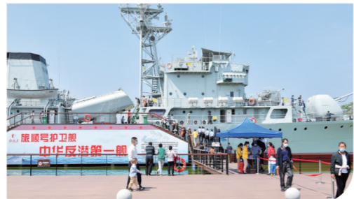
游客在兴国县红兴谷研学基地参观