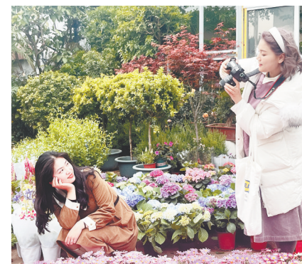
在千花伴拍照的年轻人。

应宗华也没想到,他的店铺竟在网络平台上火起来了。“我店里有上百种花,昨天还有个20万粉丝的抖音博主来拍照呢。”他笑着说,“许多大学生都慕名而来。”绿植旁、花簇间、水族店里,到处都能看到拍照、拍视频的年轻人。这情景令经营户李阿姨有些摸不着头脑,“以前逛花鸟市场的都是大爷大妈,哪能看到这么多