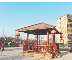
电化厂宿舍的“口袋公园”。

本报讯(全媒体记者 陈璋 )“小区旁边新建了一个‘口袋公园’,好看又实用!”近日,南昌市青山湖区青山路街道电化厂宿舍居民向江西新闻客户端“党报帮你办”频道反映。据悉,电化厂宿舍建于1986年,建筑密度大,楼间距小,周边没有配套休闲空间,车辆停放也是个问题。在区统战部部门的协调帮助下,小区西边一块3500平方米的闲置用地改造成了集儿童娱乐、老人休憩、便民停车于一体的多功能、综合性