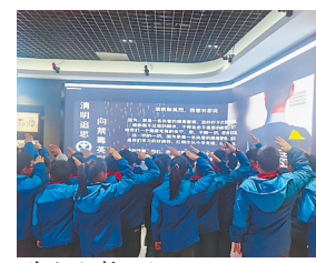
学生宣誓现场。

本报讯(全媒体记者 蔡颖辉 )“缅怀英烈的活动既让学校师生了解禁毒英烈们的艰辛付出,又增强了防范毒品意识。”南昌市红谷滩区腾龙学校老师向江西新闻客户端“党报帮你办”频道表示,日前,学校联合社区到区禁毒教育科技馆开展活动。同学们观看了禁毒英雄用鲜血和生命坚守禁毒前沿阵地的先进事迹,缅怀了历年来为禁毒事业牺牲的禁毒英烈,同时也学习各种防范毒品危害的知识,最后,在讲解员的带领下,学生们郑重宣誓:远离毒品,珍爱生命,与毒品作坚决斗争!