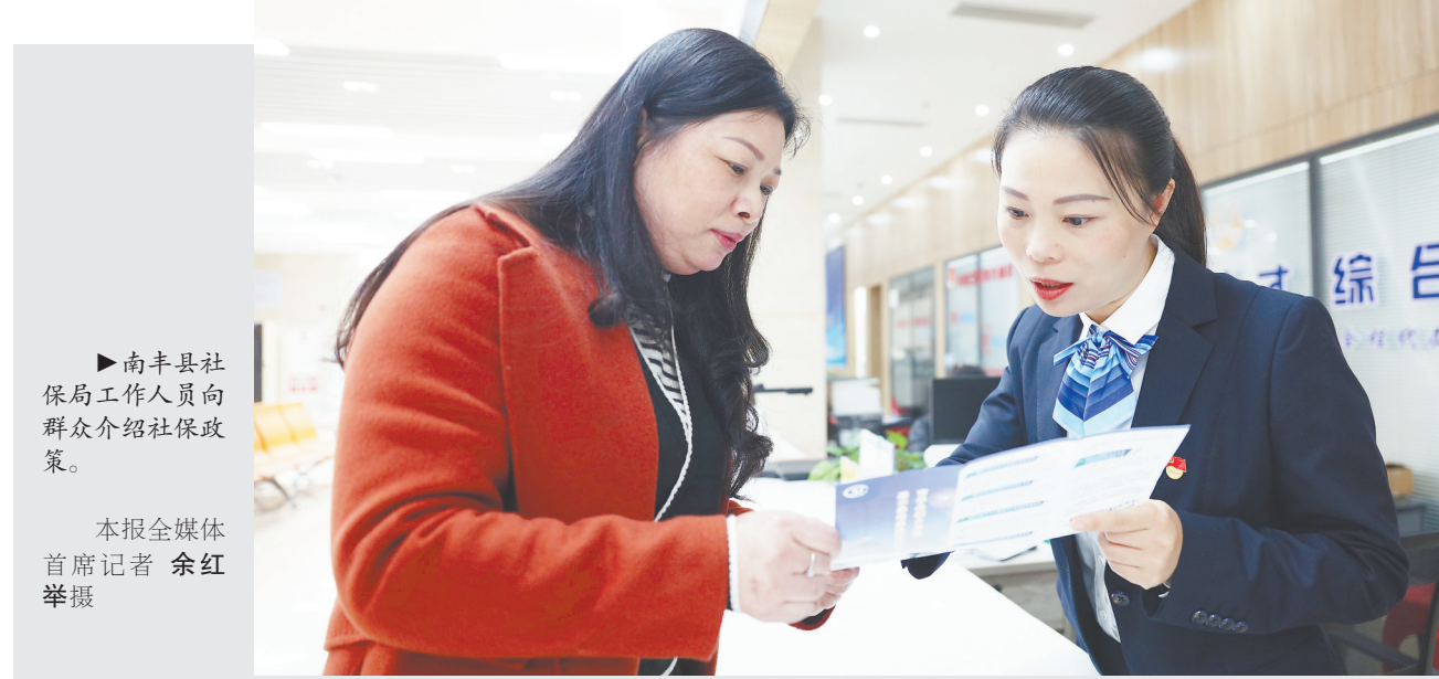
南丰县社保局工作人员向群众介绍社保政策。

守护好群众的每一分“养老钱”“保命钱”,提高追缴违规领取的社保基金效能尤为关键。