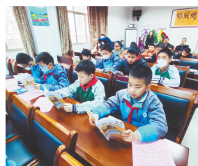
学生们在了解防范非法集资知识。

本报讯(全媒体记者 付强 )“这种宣传效果很好,既让师生获取更多金融知识,又增强了自觉防范意识。”南昌市滨江学校一些师生向江西新闻客户端“党报帮你办”频道表示,日前,南昌市东湖区教体局走进该校开展防范非法集资进校园活动。这次活动以孩子们听得懂、喜欢听的方式,通过以案释法向师生和学生家长普及与防范非法集资有关的法律知识,营造教育一个孩子,带动一个家庭,影响整个社会的的良好氛围。