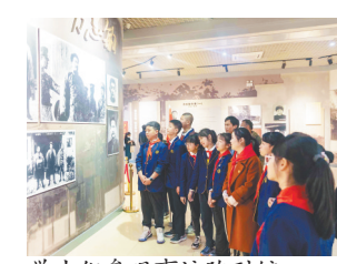
学生们参观事迹陈列馆。

本报讯(全媒体记者蔡颖辉)近日,南昌市铁路第一学校教育集团铁路路的学生向江西新闻客户端“党报帮你办”频道表示,清明节前夕,他们在学校老师的带领下来到方志敏烈士纪念馆开展了祭扫活动,“在参观过程中,我们感受到了革命先烈坚定的理想信念和深厚的爱国情怀”。祭扫活动结束后,师生们还参观了方志敏烈士事迹陈列馆,珍贵的图片、旧报纸、手写资料等将历史背景和人物联系起来,让学生