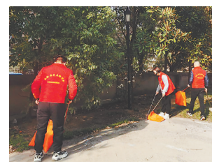
人大代表参与文明城市创建。

本报讯(全媒体记者徐黎明 通讯员田国红)“地面污水没有了,街道整洁了,要感谢人大代表的热心参与。”日前,九江市浔阳区人民路街道居民向江西新闻客户端“党报帮你办”频道反映,当地组织辖区人大代表、志愿者参与各项文明城市创建工作,营造干净、有序、整洁的城市环境。