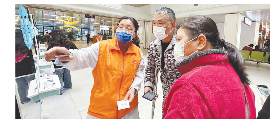
橙心助老小帮手在帮助老年患者使用自助服务机。

从门诊大厅往里走,很快便能看到一处整洁温馨、设施齐全的休憩场所——老年人智慧门诊服务驿站。沙发座椅、冷热饮水机、老年人便民箱、自助测血压仪、多媒体宣教屏,还有专门的橙心助老小帮手为老年人提供就医指导。在这里,老年人不仅可以得到各种贴心服务,每周二、四还可以参加免费课堂,了解日常保健知