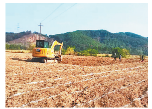
村干部带领群众参与种植业。

目前,社背村形成了水稻、油菜、香菇、蓝莓等多业态种植格局,其中香菇种植面积从无发展到80亩,仅此