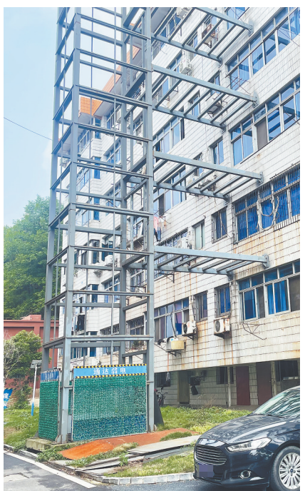
停工一年多的老楼加装电梯项目。

“我们来之前已经把这个‘烂尾’电梯的事上报给了市局,并再次联系了施工企业在宜春的负责人,责令他们必须给出一