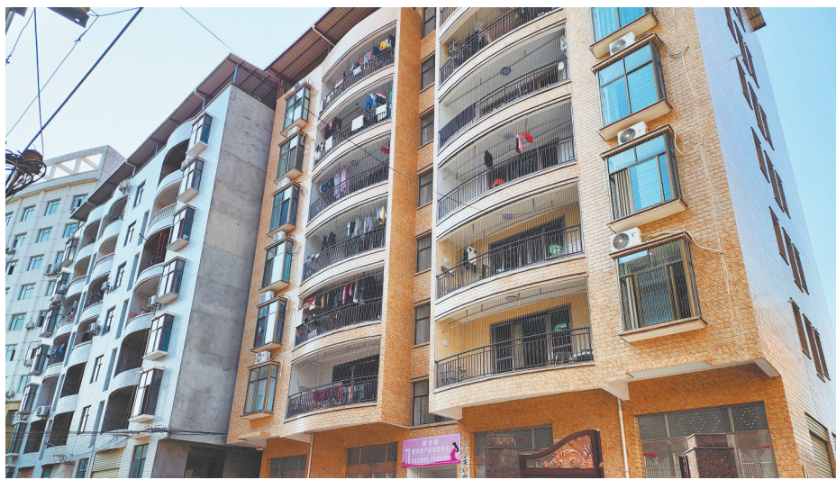
被列入旧改的红军小区居民楼。

老旧小区改造是一项民生工程,是城市更新的重要举措之一。对此,住建部有明确规定——被改造的房屋房龄应该超过20年。可是,2011年才获改造批复的瑞金市象湖镇解放社区红军小区,却又被列入瑞金市2022年城镇老旧小区提升改造项目。4月12日,记者了解到,早于红军小区竣工的城心花园小区,也属解放社区片区旧改范围内,因房龄不足未被列入此次改造。红军小区未到老旧小区改造年限,却遭区别对待,令人费解。