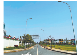
焕然一新的路灯。

记者将这一情况反馈给有关部门后,樟树市纪委监委迅速向市工业园区管委会下发督办通知书,园区各部门加快施工进度,100多盏路灯很快亮起来了。今年以来