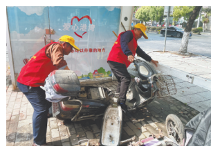
志愿者扶正倒地车辆。

活动中,志愿者们身着红马甲,认真开展交通安全劝导工作,同时对违法占道、压盲道、占用绿化带、乱停乱放