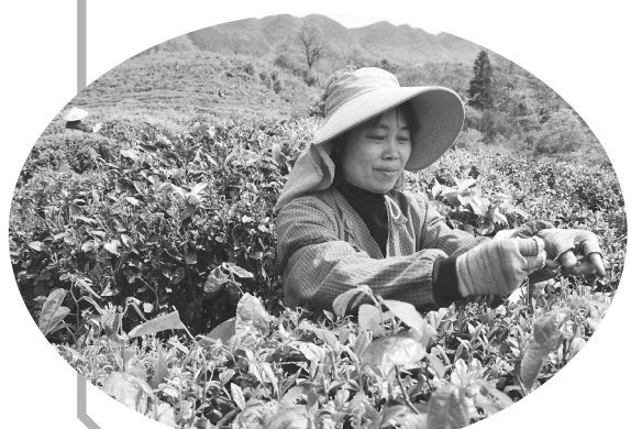
▲近日，永新县崖雾茶厂的千亩茶园，茶农们抢抓时节采摘春茶，供应市场。