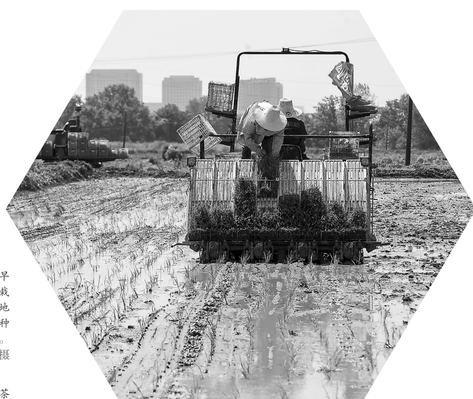
4月17日，农业机械专业合作社社员驾驶农机在进行水稻机插。目前，高安市进入春耕关键时期，当地农民抢抓农时栽插早稻。