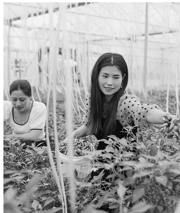
4月18日，游客在辣椒园采摘新鲜辣椒。万年县从资金投入、基地建设、市场开拓等方面加大扶持力度，推动生态蔬菜产业发展，促进农民增收。

此外，该市还在政策引导、规范管理、服务保障上下功夫，推动农村产权交易平稳健康发展，让归属清晰、权能完整的农村资产资源“动”起来、“活”起来。通过出台农村产权流转交易市场管理办法，加强交易监管，有效避免产权交易纠纷，并成立农村土地承包仲裁委员会，为产权流转纠纷调解仲裁，切实做好农村流转服务。