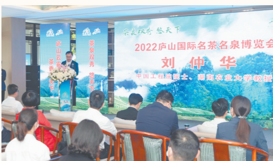
在2022庐山国际名茶名泉博览会上，刘仲华院士做主旨演讲

深入挖掘文化内涵，扩大庐山知名度美誉度；引导相关产业发展，推动文旅资源深度融合；传承发展文化事业，提升宜居宜业宜游水平……庐山市正逐步将文化资源优势转化为产业发展优势，以“重塑庐山旅游新辉煌、谱写赶超发展新篇章”为目标，改革攻坚、强产兴城、融合发展、实干富民，全力做好唱响“庐山天下悠”品牌，奋力描绘中国式现代化庐山画卷。