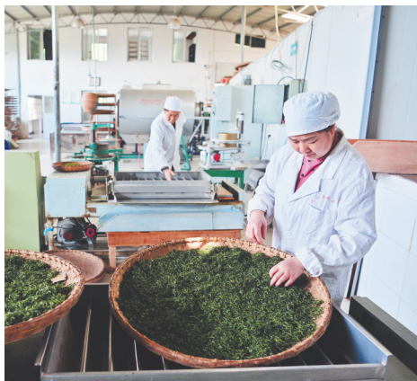
4月6日,在海拔600米的庐山市一家茶厂里,制茶师在做茶叶出厂前的最后检查。