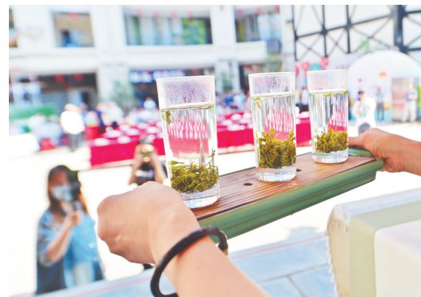
4月20日,首届谷雨茶会上的奉茶环节。