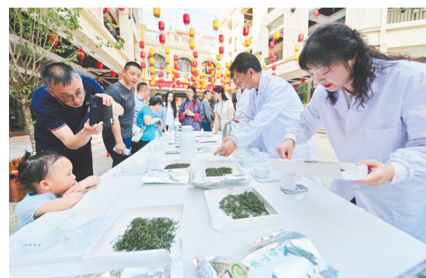
4月20日,专家在九江茶市上评审庐山云雾茶。