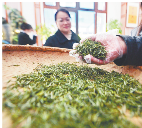
上好的庐山云雾茶条索粗壮,青翠多毫。