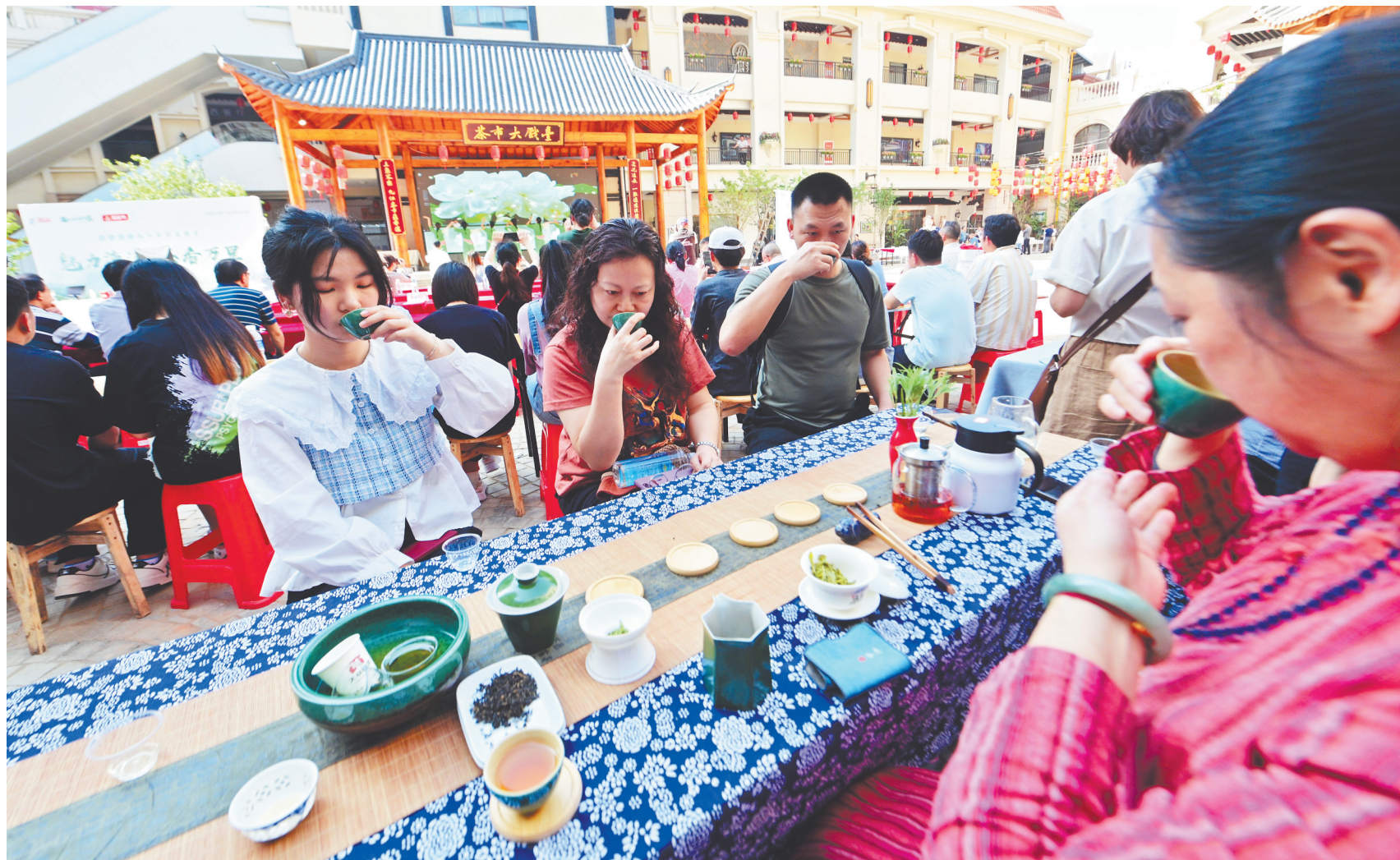
4月20日,九江茶市举办首届谷雨茶会,游客在茶市大戏台前品尝庐山云雾茶。