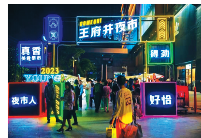
繁华热闹的王府井夜市

热闹喜庆的戏曲表演,精彩纷呈的乐队演出,琳琅满目的舌尖美食,童趣满满的游乐世界……每逢双休日,青云谱区各景区、景点的文艺演出精彩纷呈,呈现一派欢乐祥和、喜庆热烈的氛围,该区旅游市场人气热度持续攀升。(周建明)