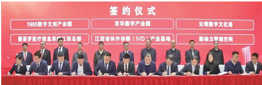
2023年青云谱区招商恳谈会暨一季度项目签约仪式现场