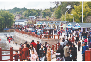
乡村旅游点游客盈门。

本报讯(全媒体记者徐黎明 通讯员刘建华)近日,寻乌县葛蒲乡的居民向江西新闻客户端“党报帮你办”频道反映,该乡打造的铜锣湾3A级乡村旅游点让当地村民多了一条增收致富路。葛蒲乡挖掘红、绿、蓝、橙、古等文旅资源,推进红色旅游项目建设,打造七彩河谷、网红索桥、龙舟竞渡等旅游项目,同时推出赏花、采果、农家乐等休闲旅游项目,还利