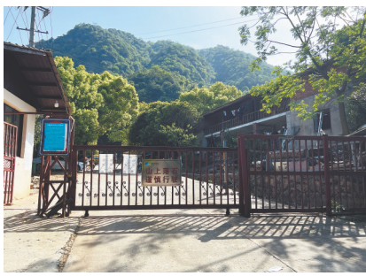
景区设卡限制农机通行。