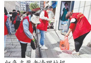
红色志愿者清理垃圾。

本报讯(全媒体记者侯艺松)“前些天,万寿宫街区人流量非常大,但环境卫生、交通秩序依旧很好,多亏了街道的工作人员。”近日,南昌市西湖区广润门街道居民向江西新闻客户端“党报帮你办”频道反映。据悉,“五一”期间,广润门街道每日接待游客60余万人次,街道党工委充分发挥“红色广润门”党建大联盟的优势,联合公安、交警、城管、市场监管等部门的工作人员坚守岗位,街道社区干部担当红色志愿