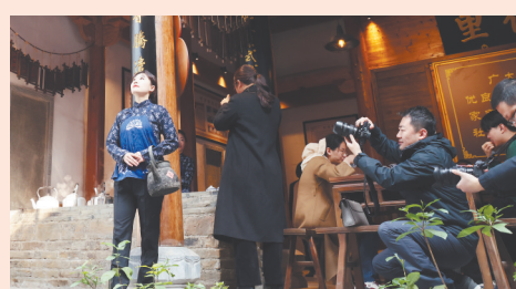
老茶馆模特表演引来摄影师拍照。