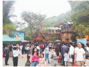
农场迎来许多游客。

本报讯(全媒体记者陈璋)“这个‘五一’假期,村里来了许多游客,农家乐生意越来越好。”近日,萍乡市湘东区白竺乡村民向江西新闻客户端“党报帮你办”频道表示。据悉,白竺乡以大丰、源头、崇源、龙台等村为试点,合作共同成立旅游开发服务公司,扎实推进桃花谷景区农产品展销中心、观光车运输服务运营,持续抓好和平农场亲子餐厅、童话树屋集体经济项目发展,做大做强