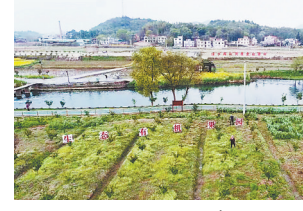
使用处理后的肥水浇灌的果园。

在人大代表的“鼓与呼”下,上栗县政府在桥头村开展农村污水治理试点,桥头村利用人大代表联络室广泛征求群众的意见建议,形成治理方案——农村污水通过净化沉淀处理,用于农作物浇灌。在污水治理探索实践