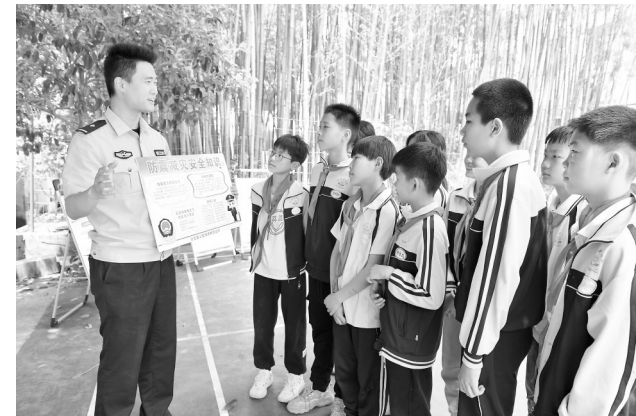
5月9日,全国防灾减灾日来临之际,分宜县公安局民警走进辖区学校,向学生宣传普及防灾减灾知识,开展防灾减灾安全教育。

景德镇市是中部地区首个、全国第13个版权示范城市。近年来,景德镇市版权局以景德镇国家陶瓷文化传承创新试验区建设为统领,把版权工作作为陶瓷文化传承创新的核心要素和陶瓷产业发展的重要支撑,积极探索版权推动陶瓷文化创造性转化、创新性发展的路径,认真统筹推进版权创造、保护、运用、管理与服务各项工作,全力推动景德镇国家陶瓷版权交易中心建设,版权工作新发展格局基本形成。据介绍,2022年,景德镇市版权登记数量达19295件,排名全省第二,增长233.02%。