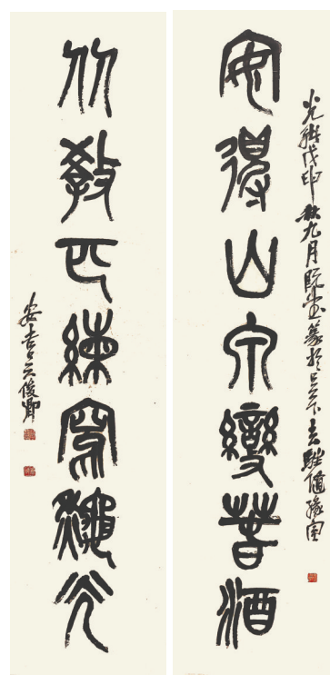
篆书对联《安得山泉变春酒,从教匹练写秋光》