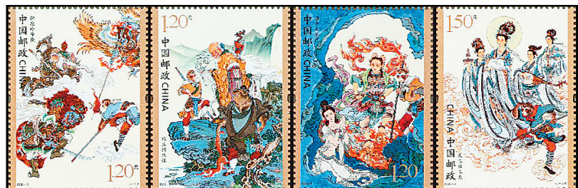
《中国古典文学名著——西游记(五)》特种邮票