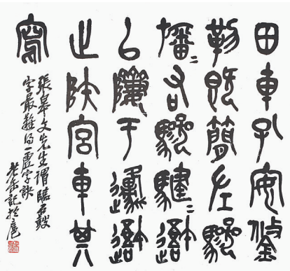
临《石鼓文》(册页选一)