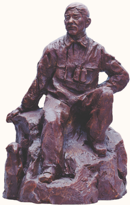
《王继才像》李继飞作

焦裕禄(1922—1964),河南省兰考县委原书记。他所表现出来的“亲民爱民、艰苦奋斗、科学求实、迎难而上、无私奉献”的精神,被称为“焦裕禄精神”。