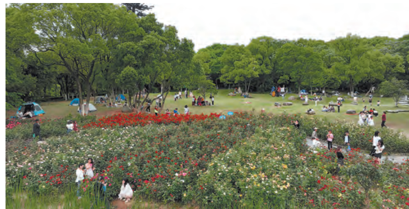
近年来,上饶市坚持“城在林中、水在城中、人在园中”的城市绿色发展理念,科学推进生态文明建设,让良好生态环境成为民生福祉。图为市民在上饶市龙潭湖公园休闲游憩。

管理干部学院紧紧围绕创建江西飞行学院这一主线,聚焦高质量专业化能力培训主阵地、高质量人才培养和高质量就业、高质量教育教学服务保障体系、高素质专业化人才队伍建设等四个方面,全校上下同题共答、协同交卷。南昌理工学院围绕民办高校党建工作重点、难点及体制机制构建研究等方面,组织校领导、中层干部深入师生,全面了解师生所思所想所盼。南昌职业大学采取集中调研与分组调研相结合的方式,聚焦作风整顿、关爱学生等问题,深入一线“解剖麻雀”。江西工业职业技术学院围绕学院改革发展中的深层次问题和“双高计划”建设发展目标确定调研课题,推动党员干部把调研成果转化为破难题、促发展的实际行动。