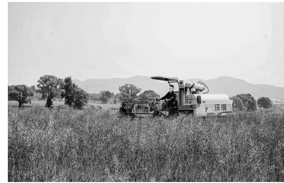
5月11日,广昌县农民正在收割油菜籽。当地抢抓时节收割利用冬闲田种植的油菜,收割后的农田将种植双季水稻,实现农业增产增效。