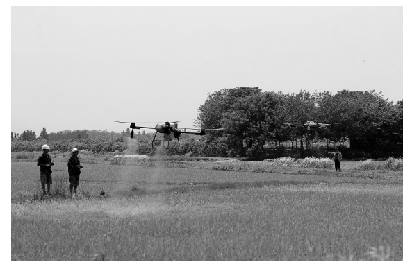
5月9日,在樟树市,“飞手”正在操作植保无人机喷施肥料。当前正值水稻生长关键期,该市组织农技员和植保专业化社会服务队分赴各村,利用植保无人机等高效植保机械开展肥料喷施,加强田间管理,确保水稻丰收增产。