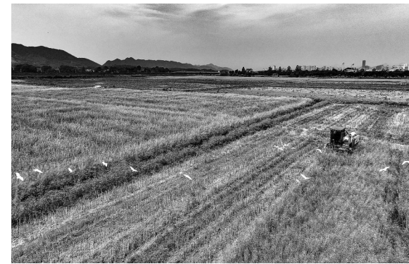
5月13日,在瑞昌市赛湖农场二分场油菜基地,农机手正驾驶收割机采收油菜籽。初夏时节,该市20余万亩油菜迎来收获期。