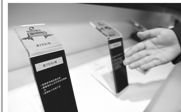
5月17日，参展人员在“信息化助力中国式现代化发展成果展”上介绍量子安全U盾产品。