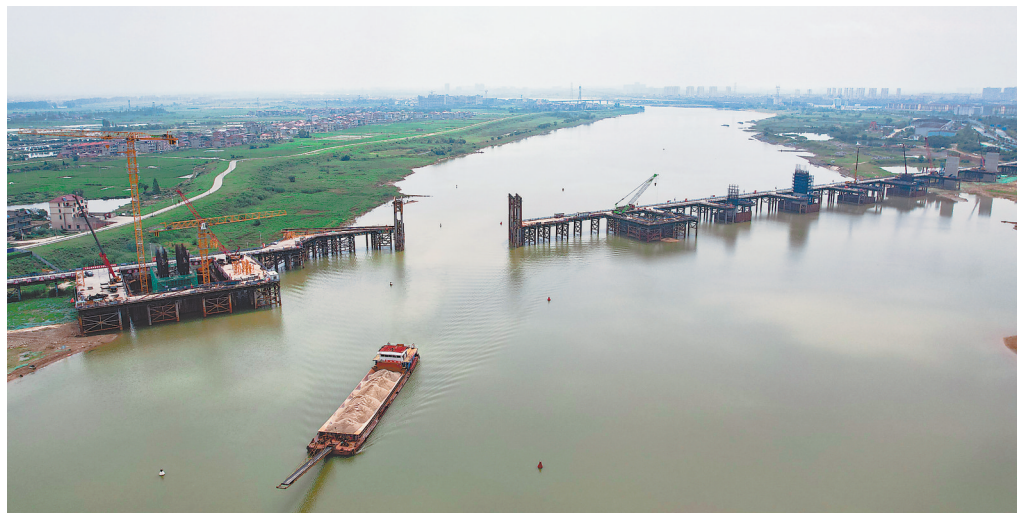
5月26日,施工人员在南昌隆兴大桥南支项目施工现场安全有序施工。目前,大桥南支桩基完成了221根、承台14个、墩身6个。

央决策部署和省委工作要求,一篙不松、一抓到底,不断把主题教育引向深入。要持续狠抓责任落实,领导干部特别是主要负责同志要切实担起责任扛在肩上,抓在手中,落到实处,确保主题教育各项工作始终有力有序扎实推进。要持续抓紧学习深化,紧紧锚定主题教育目标任务,进一步强化理论武装,夯实思想根基,坚定理想信念,铸牢政治忠诚,把握政治方向。要持续深抓调查研究, (下转第2版)