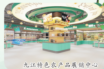
九江特色农产品展销中心