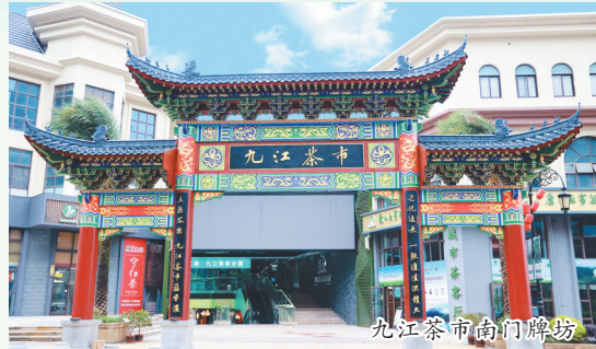
九江茶市南门牌坊

九江是我国历史上“三大茶市”之一，也是“万里茶道”上的重要节点城市，产茶历史悠久，茶文化底蕴深厚，茶产业基础良好。为进一步做大做强、做响做旺茶产业，九江市连续5年举办国际名茶名泉博览会，本届博览会于5月29日至31日在濂溪区举办，通过办好此次名茶名泉博览会暨第二届中国·九江茶市品茶会，更好地展示九江茶文化品牌内涵，不断推动茶农文旅产业深度融合、茶产业高质量发展。