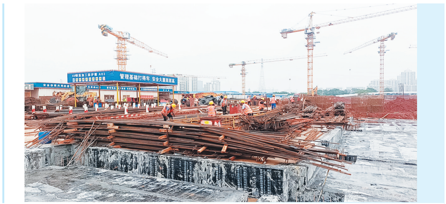
南昌市红谷滩区生米花园二期拆迁安置房建设项目位于九龙大道以东、长岗路以北、南官路以西。项目总建筑面积约33.77万平方米,可安置居民2125户。目前,该项目按进度计划有序推进,整体项目预计2025年5月完工。

同时,该纪检监察组重点聚焦公安机关在执法办案过程中接受委托,不按程序办案、降格处理等滥用自由裁量权问题,通过系统施治推动解决问题。今年以来,该纪检监察组累计督促通报相关问题13起,通报批评25人次,下发纪律检查建议书5份。 针对执法办案中一些民警纪法意识不强等问题,该纪检监察组始终坚持把廉洁教育和警示教育抓在日常,注重日常监督和谈话提醒,做到咬耳扯袖、红脸出汗,累计开展廉政谈话13人次,通过短信平台向分局全体民警、辅警发送廉政提醒短信共计4800余条。 (王小燕)