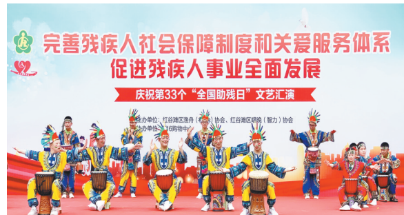
完善残疾人社会保障制度和关爱服务体系 促进残疾人事业全面发展 庆祝第33个“全国助残日”文艺汇演

为落实“双碳”行动,共建美好家园,红谷滩区对照文明城市和卫生城市的要求,于日前完成了全区钠灯改造工程。该项目采用合同能源管理(EMC)模式,对区内6700多盏钠灯进行节能改造,无需额外增加政府投资,费用全部由第三方企业垫付,减轻了财政负担。通过改造,该区全面提升了城市路灯建设管理科学化和精细化水平。 据了解,该项目涉及红谷滩区丰和中大道等46条道路,是南昌市首个采用合同能源管理模式大规模将钠灯改造成LED路灯的项目。该项目还配套新建了智控系统以及智慧照明管理平台,能够实现更科学化、智慧化、精细化的道路照明管控,助力智慧红谷滩城市建设。 项目完工后,节能效益明显,每年可节省用电量约500万千瓦时,相当于每年减少碳排放5000吨。当前该项目进入运维期,红谷滩区城市管理和综合执法局将加强管理和监督力度,将项目作用发挥最大化,让辖区群众持续获得项目带来的益处。 (冯 辰)