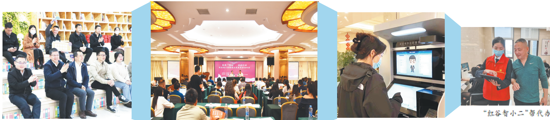
九龙湖街道“红谷连心会”活动现场