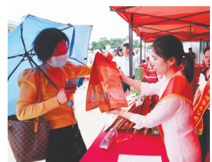
消费帮扶助力增收。铁河乡中心小学捐助2000元用于支持乡村教育事业。

本报讯(全媒体记者徐黎明)“企业家积极购买农副产品，减轻我们的销售压力，感谢他们。”日前，南昌市新建区铁河乡东山村村民向江西新闻客户端“党报帮你办”频道反映，该区工商联组织乡贤和50多家民营企业来到该村江西芟湖食品有限公司，采取以买代帮的形式购买农产品，助力群众增收。江西芟湖食品有限公司还向