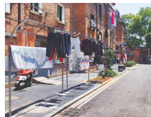
麻纺小区新装的晾衣架。 察工委了解此事后，联合京山社区干部深入居民家中详细了解情况。目前，小区多个晾衣架已装好。

原来，麻纺小区一些筒子楼以前没有固定晾晒区域，居民拿着竹竿和绳子在空地晾晒。京山街道纪检监