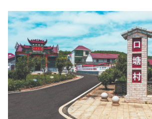
美丽的口塘村乡村振兴路。专业合作社分别达到551家、967家、705家，一大批本土乡村旅游景点和充满地域特色的农耕文化，助力乡村振兴迸发出新的活力。

本报讯(全媒体记者付强)“以前去县城，要先走2公里小路再经过几座桥才有班车，现在班车直接通到家门口，农产品跟着有了好‘出路’。”日前，安福县寮塘乡口塘村村民肖卫军向江西新闻客户端“党报帮你办”频道表示。近几年，安福县交通运输局大力推进“四好农村路”无缝衔接乡村振兴战略，积极打通交通服务“三农”的最后一公里，该县交通运输发生了翻天覆地的变化。在农村公路的带动下，去年安福县种养大户、家庭农场、农民