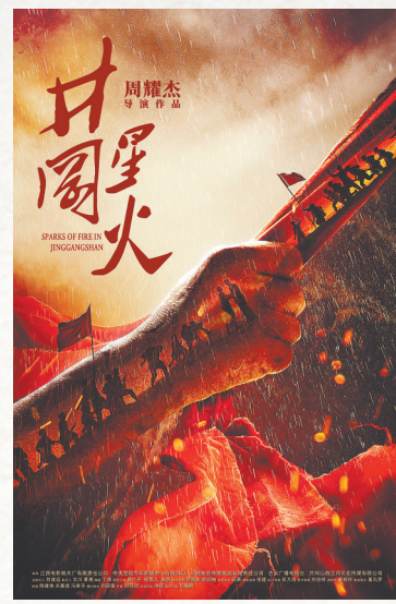
电影《井冈星火》海报

《井冈星火》从2020年开始拍摄，创作历时三年，正是艰难的疫情时期，面临着多种不确定性因素。我们在剧组建立了党支部，共产党员带头往前走，大家团结一致克服了