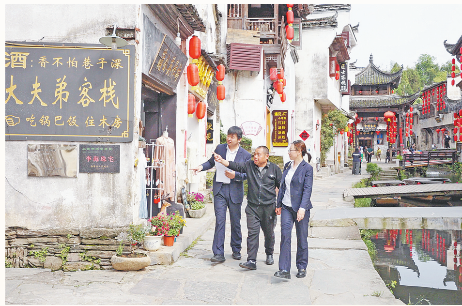
江西中行客户经理上门为商户提供“民宿贷”金融服务