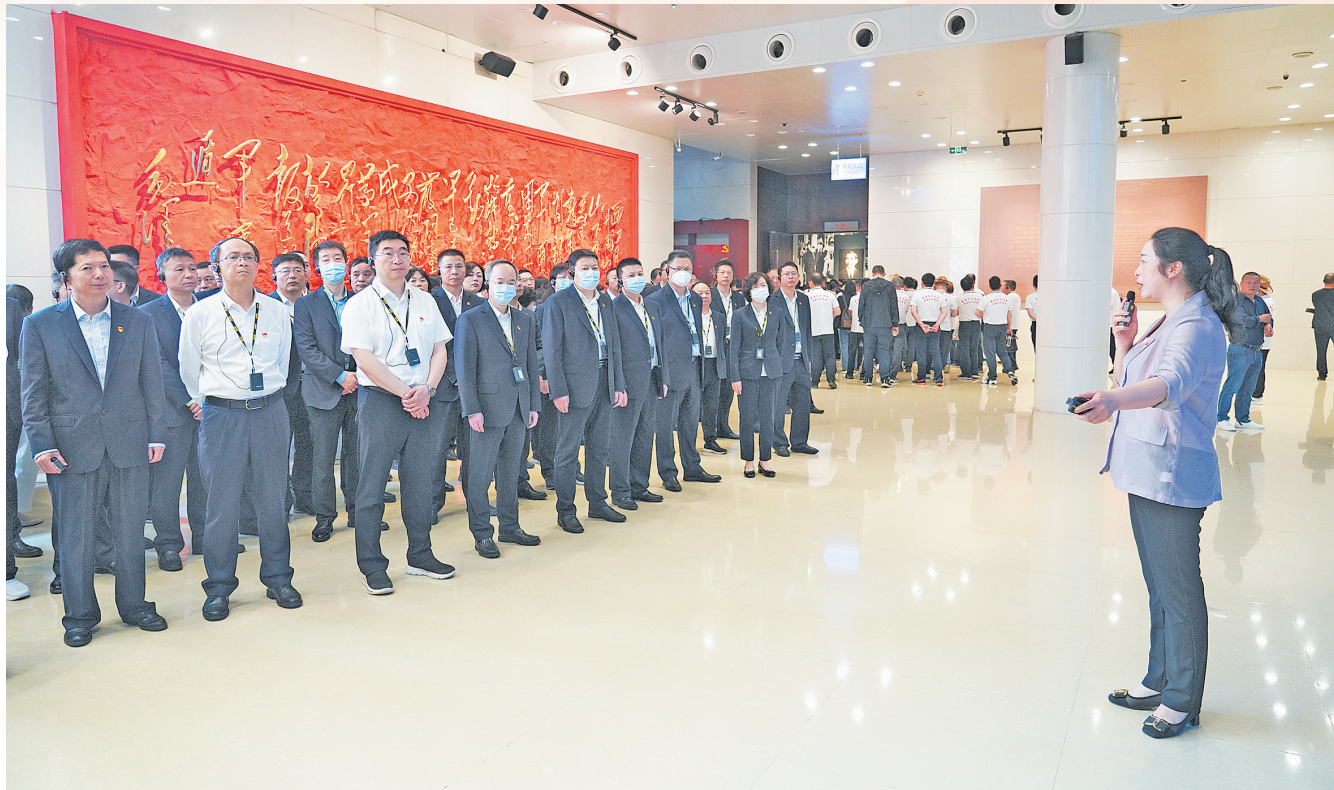
江西中行在井冈山革命博物馆开展红色教育

109载奋斗征程，109载沧桑荣耀。自南昌分号开业以来，从最初不过十人，发展到如今270余家网点、6500多名员工、存贷款规模均超3000亿元的省级分行。新时代新征程，江西中行始终坚持以习近平新时代中国特色社会主义思想为指导，聚焦“作示范、勇争先”的目标要求，积极落实省委、省政府及总行党委决策部署，履行国有大行责任担当，充分发挥中国银行全球化、综合化优势，高质量推进党的建设、高质量服务中国式现代化、高质量服务国家重大战略、高质量服务实体经济发展、高质量服务深化改革扩大开放、高质量防范化解风险，为奋力谱写全面建设社会主义现代化江西的新篇章贡献中行力量。