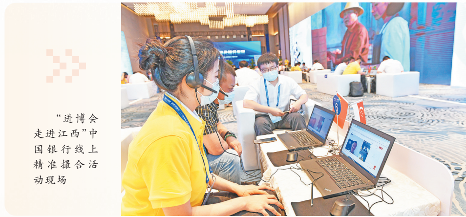
“进博会走进江西”中国银行线上精准撮合活动现场

在助力乡村振兴上提质效。城乡区域经济发展是推进乡村振兴的重要抓手之一，江西中行坚决贯彻金融支持全面推进乡村振兴决策部署，紧紧围绕江西“十四五”发展规划，积极策应“一圈引领、两轴驱动、三区协调”的区域发展战略，完善政策支持、资源配置和流程优化，持续加大乡村振兴金融支持力度。“民商贷”“甲鱼贷”“蜜桔贷”“羽绒贷”……按照“一县一品”原则，江西中行