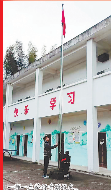
一师一生举行升旗仪式。