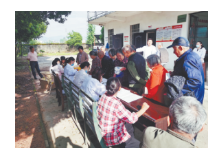
村民在排队登记体检。

本报讯(全媒体记者陈璋)“平时在村里体检不方便，感谢志愿者为我们耐心检查身体。”近日，奉新县东垦场村民向江西新闻客户端“党报帮你办”频道反映。为进一步满足老年人健康需求，解决群众急难愁盼，奉新县东垦场新时代文明实践所党员志愿者联合上富卫生院为辖区内65岁以上老年人免费健康体检，通过量血压、做心电图、腹部B超等，让老年