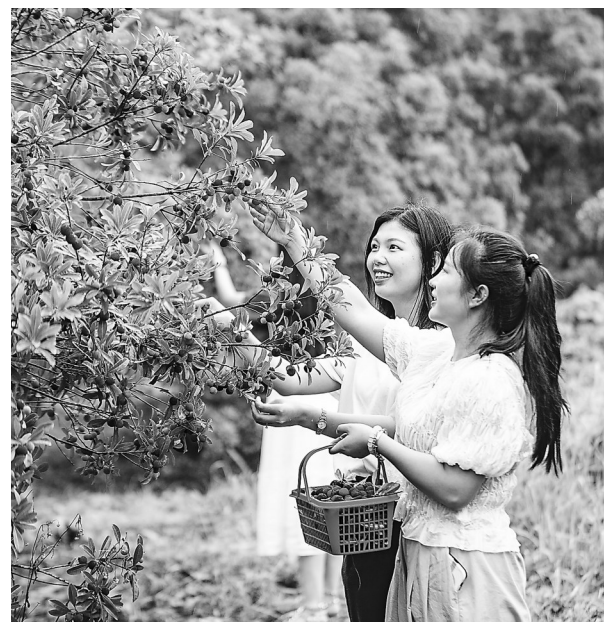
6月5日，横峰县某杨梅种植基地，红艳饱满的果实吸引不少游客前来采摘。近年来，当地以“党建+合作社+农户”方式，积极引导农户种植杨梅、水蜜桃等经济作物，促进农民增收。

会前，夏文勇实地调研了赣南稀土新材料中试关键技术研究基地和江西省碳中和研究中心，了解我省部分领域科技成果转化和产业化有关情况。