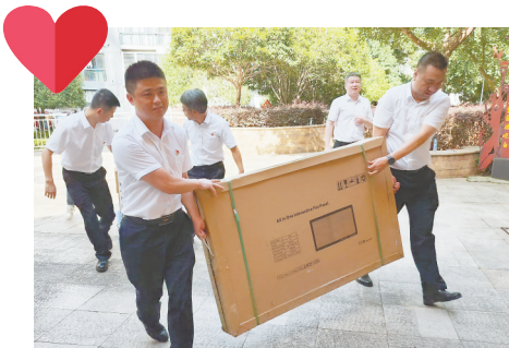
▲爱心单位志愿者为社区搬运爱心物资。