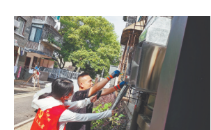
安装油烟净化装置。

本报讯(全媒体记者洪怀峰)近日,南昌市青云谱区洪都街道洪西社区居民向江西新闻客户端“党报帮你办”频道反映,社区临街开了一家餐饮店,每天产生浓浓的刺鼻油烟味,加上持续高温天气,油烟味越发呛人。对此,洪西社区立即联合片区民警,邀请居民代表和店主现场协商。经多方调解,餐