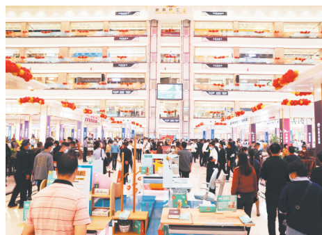
南康家具交易市场面积已超30万平方米

南康区创建“南康家具”区域品牌，成为全国第一个以县级行政区划地名命名的工业集体商标，2022年重新遴选出264家“南康家具”集体商标使用企业，为引领家具产业持续优化升级打下坚实基础。同时，加快推进南康家具“百城千店”项目，先后与南京、长沙等城市的高端家具卖场签约56家品牌馆，开设连锁专卖店300多家，企业自营店、加盟店8万多家。