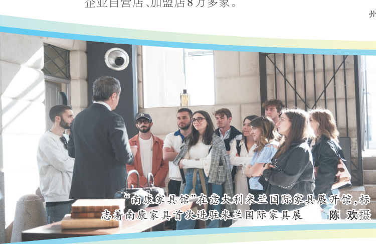
“南康家具馆”在意大利米兰国际家具展开馆，标志着南康家具首次亮相米兰国际家具展