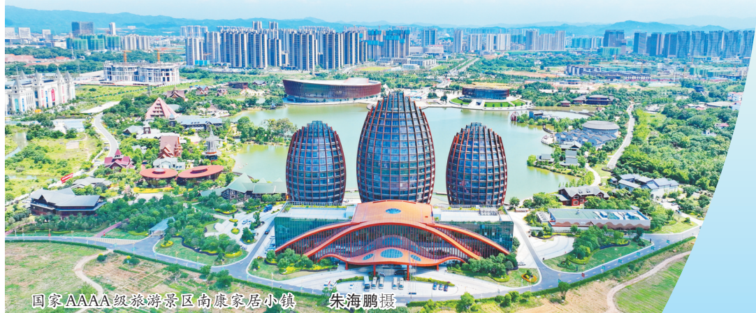
国家AAAA级旅游景区南康家居小镇

经历了原始积累、转型升级的南康家具产业，近年来迈入高质量发展的阶段，实木与软体比翼齐飞，南康家具发展的空间扩大了，南康区成为国内产业链条最完善、配套最齐全、最具竞争力的家具产业高地之一，实现了产业总产值突破2500亿元，在全国乃至全球家具版图中，南康无疑是浓墨重彩的部分。