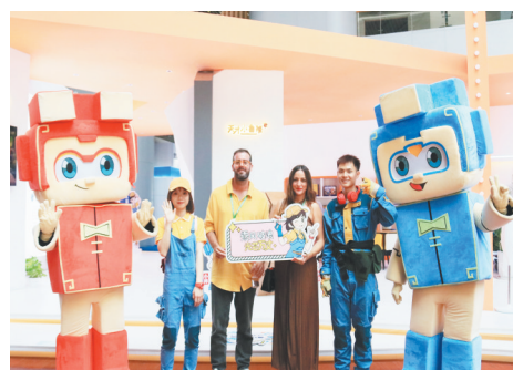
南康城市IP“天才小鲁班”亮相中国（赣州）第十届家具产业博览会

南康区是中国实木家居之都。长期以来，多道贩运、成本高企，导致南康家具产业利润空间小、附加值低，品牌培育困难，产业升级步履维艰。这一度是南康家具产业发展的困境之一。