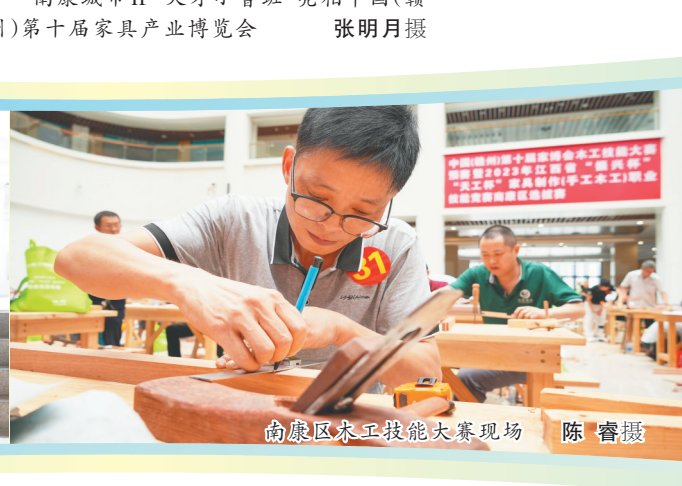
南康区木工技能大赛现场