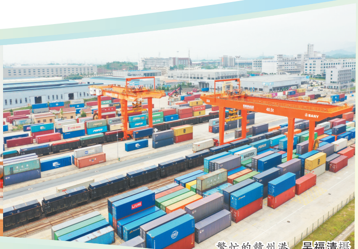
繁忙的赣州港