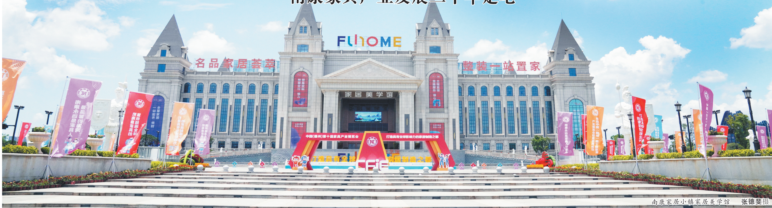
南康家居小镇家居美学馆