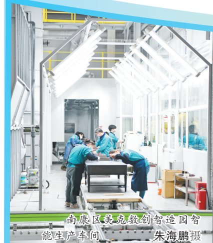
南康区美克敏创智造园智能生产车间

百舸争流，千帆竞发。三十而立，风华正茂。南康家具正朝着“让世界有家的地方就有南康家具”这一梦想阔步前行。