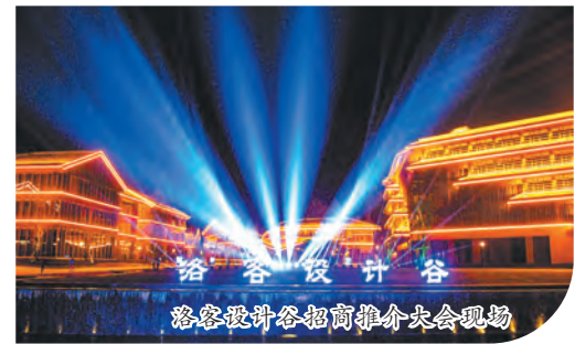
洛客设计谷招商推介大会现场