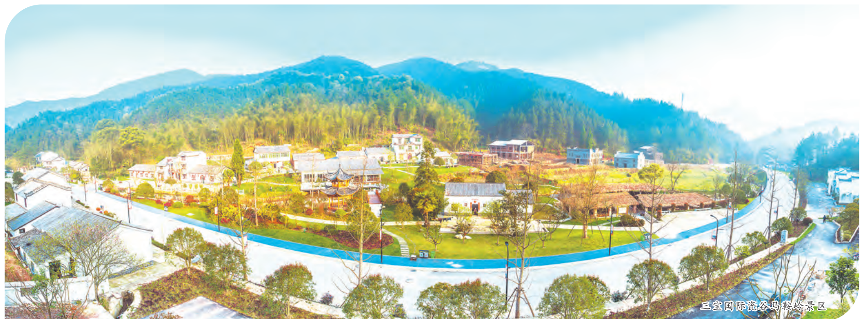
三宝国际瓷谷马鞍岭景区