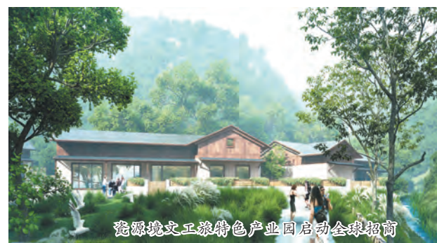
景德镇文工旅特色产业园启动全球招商