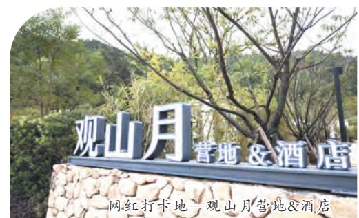
网红打卡地—观山月营地&酒店

三宝国际瓷谷，不只有诗和远方，更有人间烟火气，逐渐打造成世外“陶”源生活的新样本。