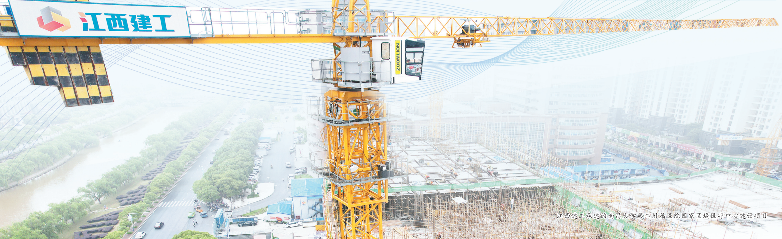
江西建工承建的南昌大学第二附属医院国家区域医疗中心建设项目