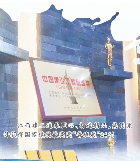
江西建工追求卓越、打造精品，集团累计获得国家建筑最高奖“鲁班奖”24项

数字是最有力的说明。截至目前，江西建工累计完成企业生产总值5000亿元，建成各类项目2.2万余个。尤其是改制以来的十年间，集团上缴利税209亿元，每年为10万余名农民工提供了稳定的就业岗位，在助推全省经济发展的同时，维护了企业和社会的稳定。