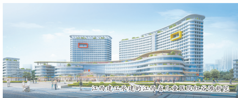
江西建工承建的江西省儿童医院红谷滩分院

建工人建造了一大批优质精品工程，创国家建筑最高奖“鲁班奖”占全省的半壁江山，尤其是2016年至今连年均获“鲁班奖”。截至目前，集团累计24项工程获得国家建筑最高奖“鲁班奖”、国家优质工程奖6项，江西省“杜鹃花奖”173项，省级优质工程468项，成为省内建筑企业的标杆。