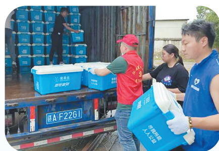
江西建工小鲁班志愿者积极参与志愿服务活动