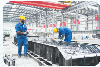
国家住建部正式评定江西建工为第二批“国家装配式建筑产业基地”，树立了行业发展的标杆