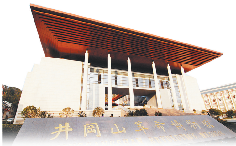
江西建工承建的井冈山革命博物馆新馆——新中国成立60周年百项经典精品工程(国家建筑最高奖——“鲁班奖”)(江西省建筑工程质量最高奖——“杜鹃花奖”)

面对建筑行业绿色化、低碳化的发展趋势，江西建工顺势而为，把握契机，大力发展装配式建筑，将装配式建筑作为企业转型升级和延链补链强链的重要举措，在安义县建设省内领先、国内一流的江西建现代建筑产业园，拥有装配式建筑基地、新型建筑材料生产基地等核心基地，与知名院校和科研机构展开深度合作，成立装配式技术研究院，强化科技创新引领。主编参编省内多项行业标准，为江西装配式产业发展提供“江西建方案”。2020年9月，住建部正式评定江西建工为第二批“国家装配式建筑产业基地”，树立了行业发展的标杆。