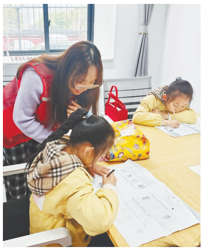
青原区民政局开设困境儿童“周末课堂”辅导班。

今年以来,青原区民政局努力打造“困难主动发现、救助高效便捷”的社会救助方式,充分发挥村(社区)社会救助协理员作用,延伸基层服务触角,及时发现居民生活困难及遭遇突发事件、意外事故、罹患重病等急难情况,做到早发现、早救助、早帮扶,实现困难群众帮扶救助全覆盖、兜住底、无遗漏。同时,该局开通“12345”便民服务热线,对群众遇到紧急性的生活困难,实行先行救助,事后再按程序补办相关材料,及时为困难