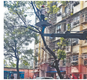
工作人员在修剪树枝。

本报讯(全媒体记者蔡颖辉)“小区里的树木修剪后,房间里变得亮堂了,既方便了群众,又减少了隐患。”近日,南昌市西湖区南站街道铁路四村社区居民向记者诉苦,对小区内树木过于茂盛给居民造成困扰的实际诉求,立即对辖区居民情况进行全面