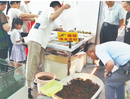
农贸市场小龙虾价格亲民。

进入盛夏,小龙虾加入了“夜宵小天王”的行列。与火爆消费的热度相比,作为夜宵主角小龙虾,近期价格持续走低,让爱吃者实现“吃虾自由”。