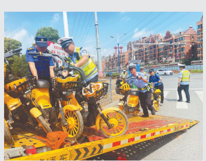
▲交警与城管开展联合整治。 ▲整治前,金沙二路人行道上停放的大量美团无牌共享电单车。

为维护道路交通安全秩序,规范电单车管理,有效遏制无牌车辆上路行驶所带来的交通安全隐患,南昌交警开展了无牌电单车“清零行动”,取得了一定效果。近日,有群众反映,在南昌市区虽然看不到无牌电单车了,但在与市区接壤的南昌县象湖板块,却有企业将无牌共享电单车投放运营,给群众出行与交通管理工作带来了安全隐患。