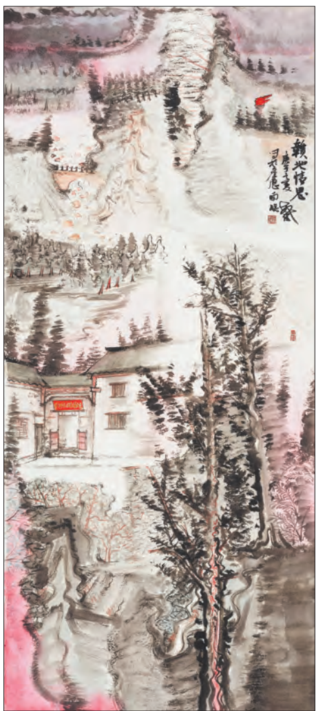
国画《赣地情思》熊敏鹤绘