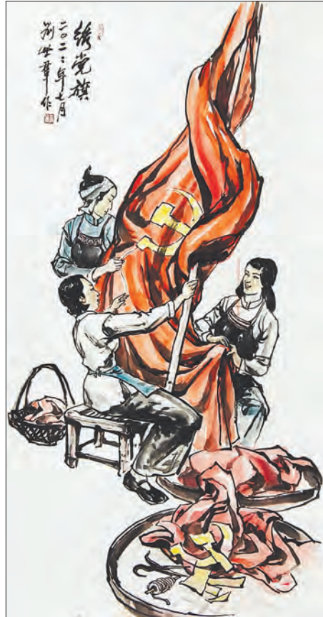
国画《绣党旗》刘世群绘 刻字《新征程》官仲达刻 国画《大堤暴动》鄂江绘 行书《党恩播福泽,九州昌盛千家乐;国策降袂祥,百业兴隆万里春》张华武书