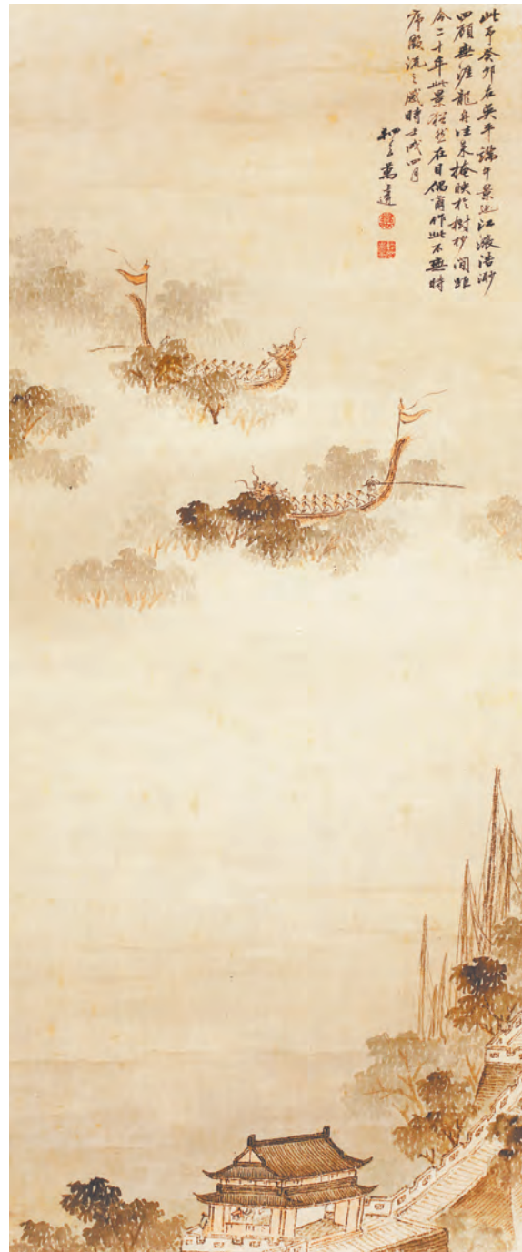
《龙舟竞渡图》万上遴(清代)绘

万上遴(1739-1813),字殿卿,号桐冈,江西分宜人,曾任清宫画院待诏。翁方纲任江西学政时,他随翁方纲视学广信府,游贵溪天冠山。根据万上遴生卒时间推算,“癸卯”为1783年,属乾隆时期,距今年癸卯年正好四个甲子,240年。