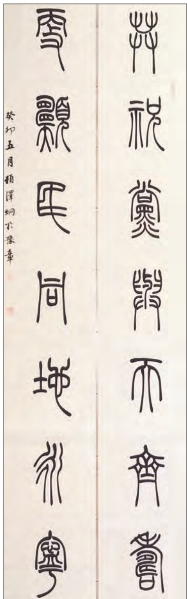
篆书《共祝党与天齐寿, 更愿民同地永宁》赖泽炯书