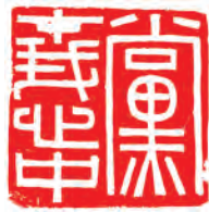
篆刻《党在我心中》彭湃刻