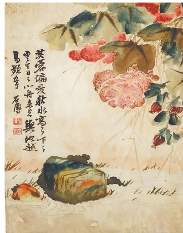
石涛《杂画册页》（选二）故宫博物院藏

钦 赐 点 进 殿 翰 士 试 贵 林 及 一 府 捷 院 第 甲 少 报 修 第 一 大 老 撰 名 翁 张 甲 睿 恭 应 名 林 恭 应