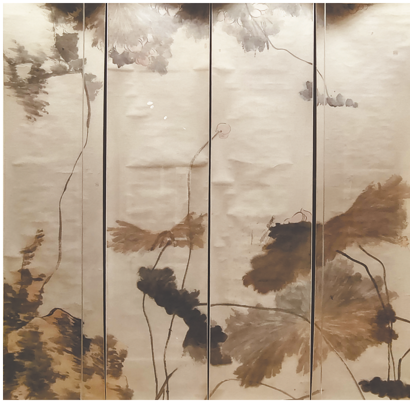
八大山人《荷花（通屏四联）》局部，因过高，底部未全展开。中国美术馆藏

中榜者收到喜报后，一般要将其张贴在厅堂显位，让人一进门便能看到，以此炫耀，光耀门庭。