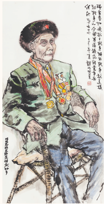
《杨根思战友、抗美援朝老兵何庆》 陈桂明绘