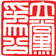
篆刻 《立党为公》 黄紫萱刻