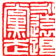
篆刻 《永远跟党走》 翁志彪刻