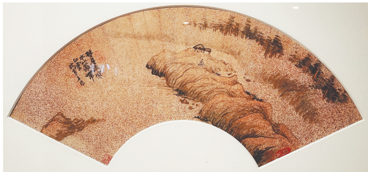
石涛《山水扇面》 四川博物院藏