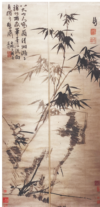
八大山人、石涛《兰竹图》中线条为展陈玻璃接缝。广州艺术博物院藏