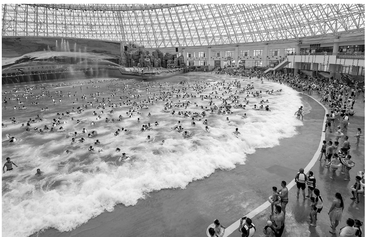
7月8日，游客在安徽省芜湖市南陵县大浦乡村世界的海馆馆戏水游玩。