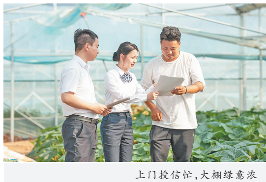
上门授信忙，大棚绿意浓

如何引导金融活水流向田间地头，是金融支持乡村振兴的“必答题”。弋阳县是革命老区县、西部政策延伸县。该县下辖17个乡镇（街道），人口42万，其中农业人口33万。作为扎根农村市场、服务农村群体的地方性法人金融机构，弋阳农商银行对“三农”的感情最深厚、联系最紧密。正因为如此，弋阳农商银行在开展整村授信、创新产品支小支微、助力“三夏”（夏收、夏种、夏管）等工作成了上饒乃至全省农商银行系统的一面旗帜。弋阳农商银行通过整村授信评议产生白名单6.56万户，占农户总数的76.86%，新增授信18925户、金额26.02亿元，新增授信8081户、金额15.79亿元，办贷效率、服务质效均明显提升。