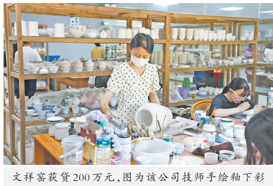
文祥窑获贷200万元，图为该公司技师手绘釉下彩

千年瓷都景德镇，是中国最具魅力文化旅游城市和世界手工艺与民间艺术之都之一。近年来，景德镇积极推进国家陶瓷文化传承创新试验区建设，努力打造一座与世界对话的城市，推动瓷都走向更加辉煌。景德镇农商银行深度融入地方经济社会发展主旋律，与之共生共荣、同频共振，大力推广普惠金融，倾情支小支微、服务实体经济，以金融之力助推世界瓷都景德镇的高质量发展。截至2022年末，全行存贷款规模达534亿元，居本地金融机构第一位，经营质效持续居于江西辖内设区市农商银行第一方阵。