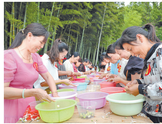
7月7日,广昌县赤水镇举行白莲加工技艺竞赛,该镇13个村的33名选手比拼加工莲子的速度和质量。广昌白莲生产技艺与习俗是我省省级非物质文化遗产,每年白莲丰收时节,广昌各地都会举办竞赛活动。

师事务所、人力资源、物业商管等企业资源,建立供应和需求“两张清单”,实现供需对接,促进了人力、资金、场地等高效互通。同时,有机链接所在社区、行业协会、辖区单位等党组织,与商圈党支部签订共建协议,有效融合团组织,逐步形成充满活力、密不可分的党建共同体,使商圈逐步成为引领企业家干事创业的发展共同体。今年以来,各商圈党支部累计为企业提供业务连线20次,解决小微企业贷款1000余万元,带动产生商圈经济效益达5000万元。