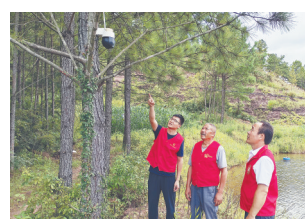
网格员查看山塘水库情况。

为有效防范溺水事故发生,小密乡结合辖区水域分布情况,对24个水域安装了摄像头和“云喇叭”,一旦发现有人进入危险水域,巡查人员第一时间用“云喇叭”提醒劝阻,并通知村里的网