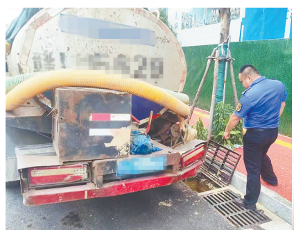
执法人员核查被排入污泥的雨污渠。