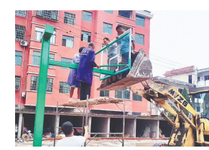
施工人员在安装篮球架。

对此,刘公庙镇政府和天佑社区筹集资金重新规划建设篮球场。新篮球场不仅安装了照明设备,还添置了