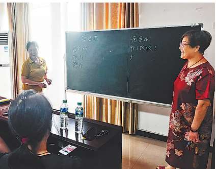
“老漂族”驿站的南昌话课堂。