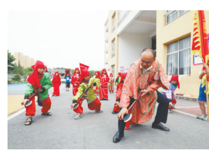
老师在教学生跳傩舞。

自“双减”政策全面实施以来,当地因地制宜挖掘地方文化,增设了非遗课程。上课时,“小非遗”们头戴面