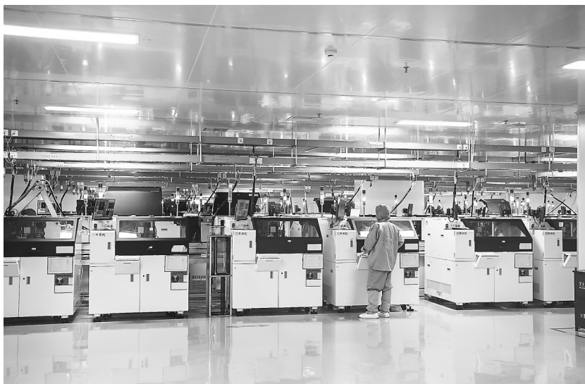
7月11日，江西兆驰晶显有限公司繁忙的生产线。

近年来，我省加快链链补链强链，产业集群建设持续提升，营业收入过百亿元的产业集群已达105个，其中过500亿元的有20个、过千亿元的有5个。