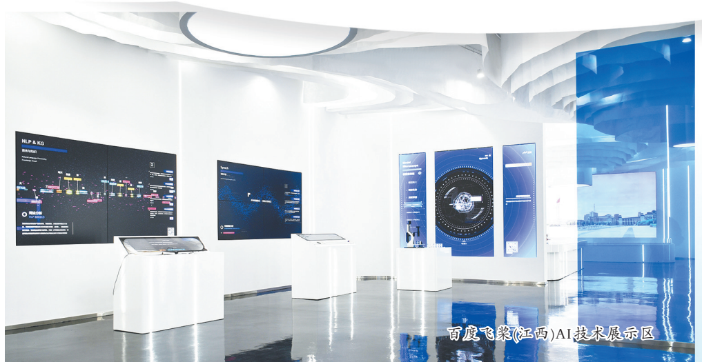
百度飞桨(江西)AI技术展示区