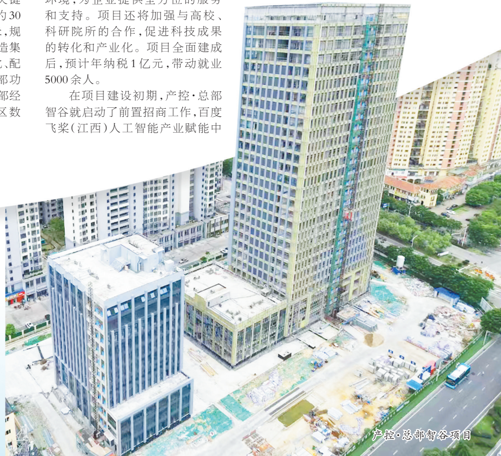
产控·总部智谷项目