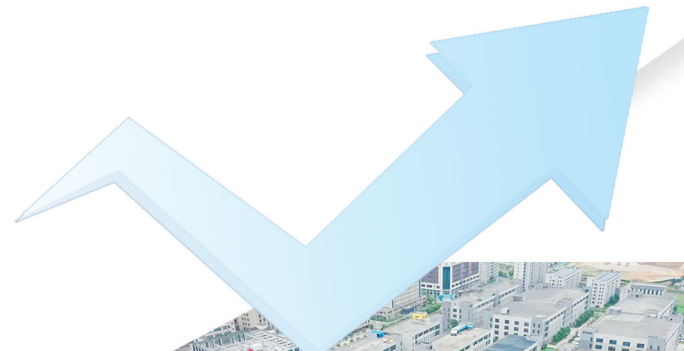
科晨电力研发总部大楼项目