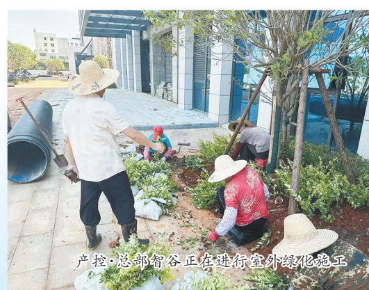
产控·总部智谷正在进行室外绿化施工