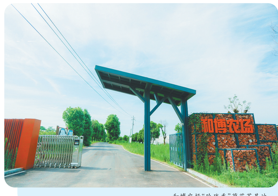
和博农场“玲珑香”菊花茶基地