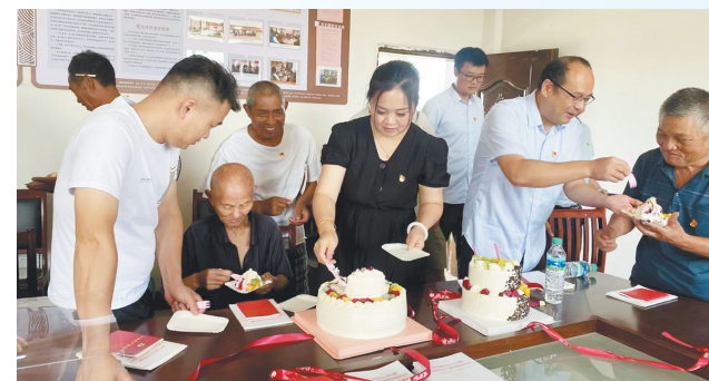
石埠镇竹园村党支部和老党员共庆中国共产党的生日

山水为笔绘新卷，梦圆千年写华章。如今，放眼这方生机勃勃的土地，处处展示着新变化、新气象、新干劲。未来，在实施乡村振兴战略的伟大实践中，石埠镇将始终不忘初心、牢记使命，不断释放发展动能、激荡发展豪情，以锐意进取的开放姿态，谱写更加绚丽的时代新篇章。