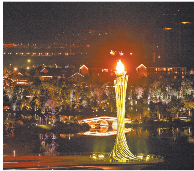
7月28日拍摄的成都大运会主火炬。