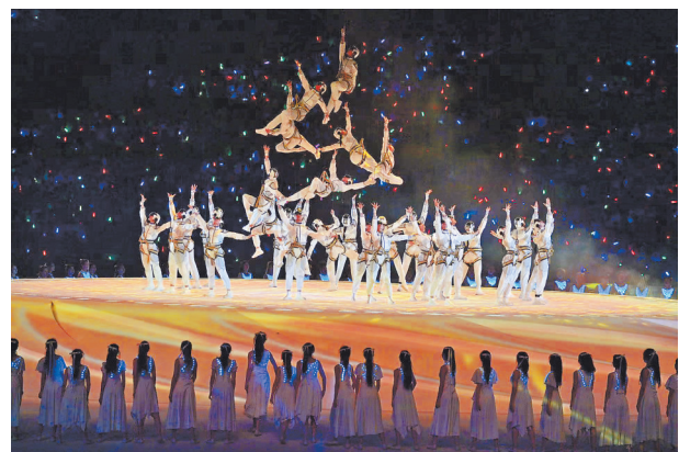
7月28日，演员在开幕式上表演。