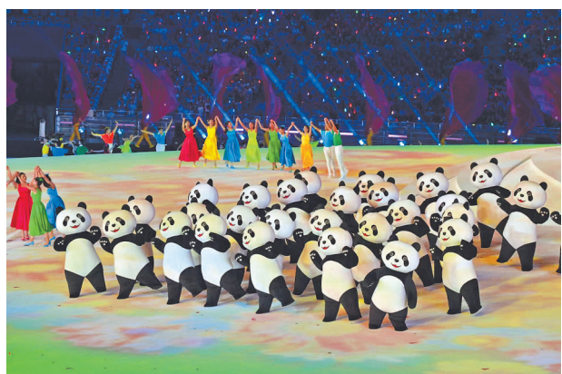
7月28日，演员在开幕式上表演。