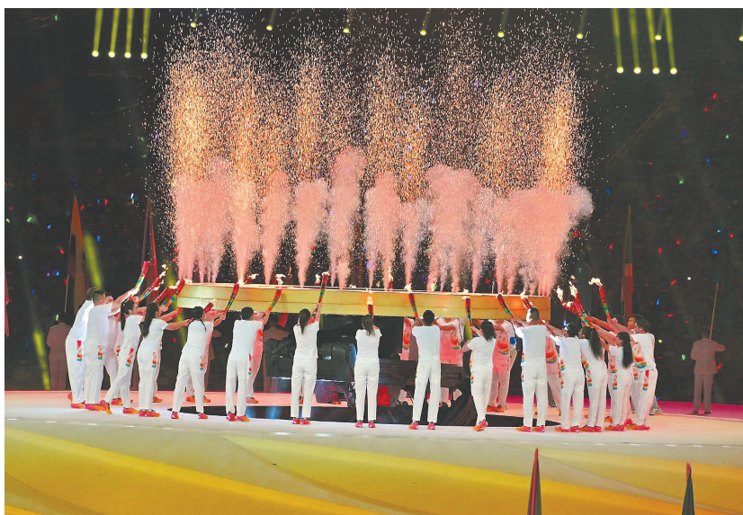
▲点燃主火炬仪式。