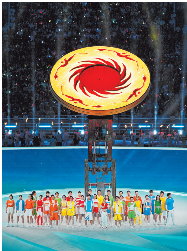
7月28日，演员在开幕式上表演。