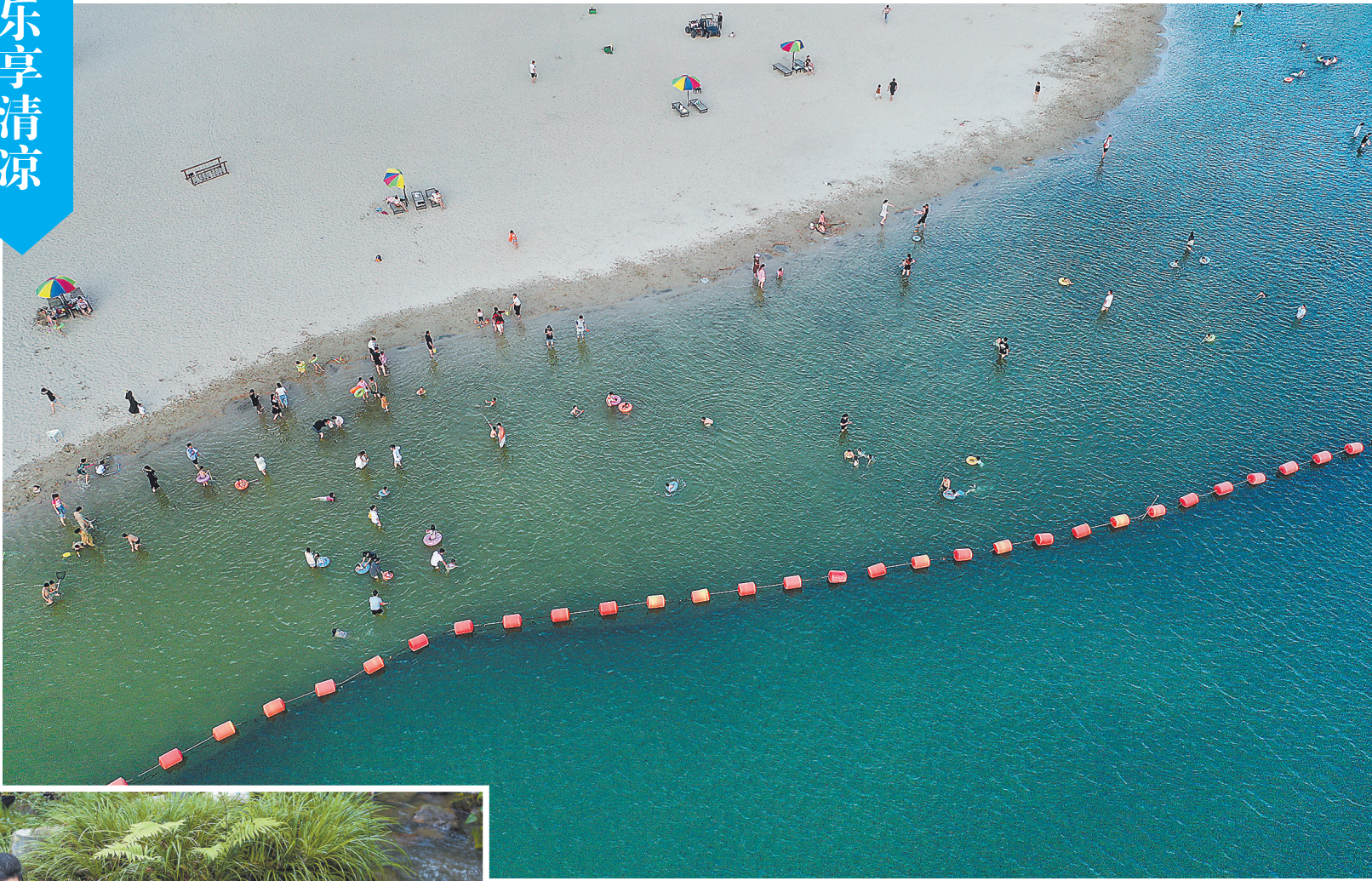
▲近日，抚州市东乡区佛岭国际公园，市民或漫步沙滩，或在水中畅游，乐享清凉。持续高温天气，可以沙滩吹风、浅水畅游的佛岭国际公园，成为当地的网红打卡地。