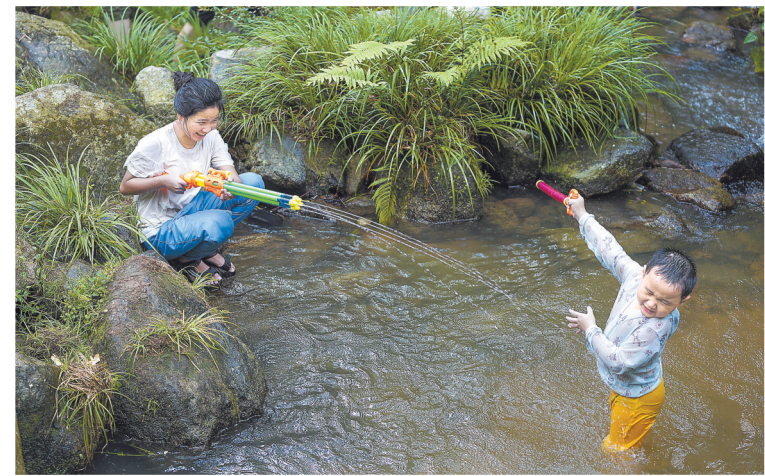
▲8月5日，南昌市湾里管理局太平镇神龙潭景区绿树成荫、凉意十足。不少市民带着孩子在山涧露营戏水，在青山绿水间放松心情，感受夏日清凉。